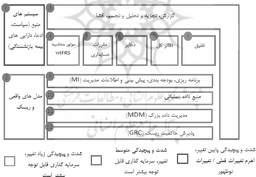
شکل ۱- تأثیرات اجرای استاندارد گزارشگری مالی شماره ۱۷

برای بیمه‌گران، محتوا و ساختار داده‌های گرفته شده از محصولات، اوراق بهادار و واحدهای تجاری برای پشتیبانی از گزارش‌های استانداردهای بین‌المللی گزارشگری مالی 17 به طور قابل توجهی تغییر خواهد کرد. برای این امر نیاز به تغییرات در سیستم‌های حسابداری و مالی است (استیج لانس، ۲۰۱۶). علاوه بر این، تغییرات در صورت‌های مالی و افشاء اولیه بر ساختار حساب‌ها و نمودار حساب‌ها در سطح گروه و واحد تجاری تأثیر خواهد گذاشت. درک شکاف‌های داده‌ها، سیستم‌ها و فرایندها برای موفقیت استانداردهای بین‌المللی گزارشگری مالی 17 اهمیت خواهد داشت (بئیر و همکاران، ۲۰۱۰). این به تجزیه و تحلیل دقیق معماری سیستم‌های موجود، قابلیت‌ها و توانایی‌های آن نیاز خواهد داشت تا بهترین ترکیب سیستم‌ها را برای حالت هدف که از شرکت‌ها پشتیبانی می‌کند، طراحی کند. در شکل (۱) این تأثیرات نشان داده شده است (ارنست و یانگ، ۲۰۱۸).