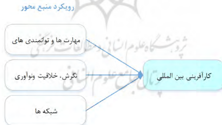
شکل ۱: رویکرد منبع محور و کارآفرینی بین‌المللی (گیلیچانگ و همکاران، ۲۰۱۳)

گیلیچانگ ۱ و همکاران (۲۰۱۳) در تحقیق خود چارچوبی از منابع که بر کارآفرینی بین‌المللی تأثیرگذار است را مطرح کرده‌اند که عبارت است از: مهارت‌ها، نگرش، خلاقیت و نوآوری و شبکه. بنابراین می‌توان نتیجه گرفت که مهارت‌ها، خلاقیت و نوآوری و شبکه‌ها عواملی مهم و تأثیرگذار در تمایل به انجام پروژه‌های بین‌المللی هستند که برای موفقیت در زمینه بین‌المللی، افزایش سرعت بین‌المللی شدن، شناسایی به موقع فرصت‌های بین‌المللی و پیشگام بودن در حوزه‌های بین‌المللی باید به آن توجه داشت. این چارچوب به شرح شکل ۱ است.