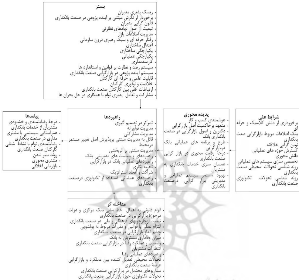
شکل ۱. مدل نهایی تحقیق