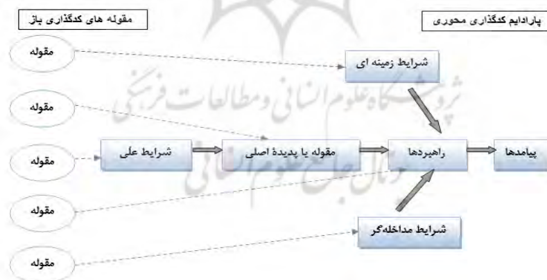
نمودار ۱: مدل پارادایمی -نظریه پردازی داده بنیاد

همچنین استراتژی پژوهش از لحاظ بعد کیفی به دلیل اینکه مسیر پژوهش، مصاحبه با افراد و شناسایی مفاهیم مرتبط و مدل سازی آنها بوده است، بنابراین، استراتژی تحقیق داده بنیاد ۱۹ انتخاب شده است. نظریه داده بنیاد روشی است که هدف آن شناخت و درک تجارب افراد از رویدادها و وقایع در بستری خاص است (استراوس & کربین، ۱۳۹۵). تئوری داده بنیاد به دنبال ایجاد نظریه است. نظریه ای که ریشه در داده های مفهومی دارد و براساس جمع آوری و تحلیل نظام مند آنها تولید شده است. رویه های تئوری داده بنیاد طراحی شده اند تا مجموعه ای از مفاهیم منسجم را توسعه دهند که تبیین تئوری کاملی از پدیده اجتماعی مورد مطالعه (در این پژوهش، این پدیده تامین مالی در صنعت فولاد کشور است) ارائه دهند. بخش های مختلف مدلسازی براساس مدل پارادایمی داده بنیاد در نمودار یک نمایش داده شده است.