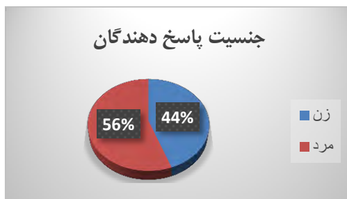
نمودار شماری ۲: توزیع جنسیت پاسخ دهندگان

سطح تحصیلات پاسخ دهندگان همان‌طور که جدول شماره ۴ نشان می‌دهد، مدرک تحصیلی ۱۳ درصد پاسخ دهندگان، زیر لیسانس، ۶۳ درصد فوق لیسانس و ۲۳ درصد دکتری و بالاتر است.