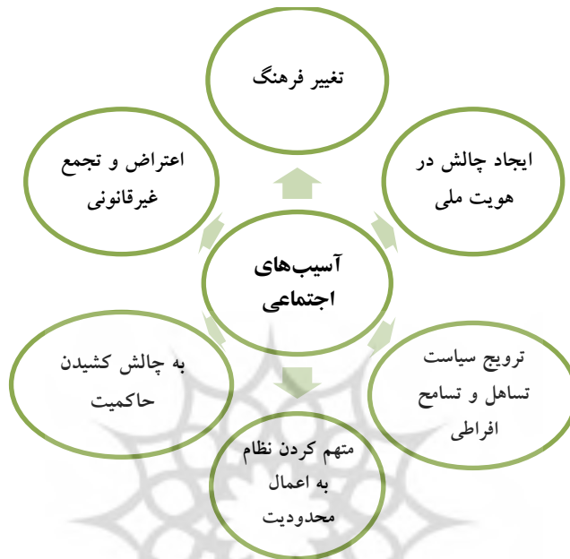
نمودار شماره ۱: آسیب‌های اجتماعی عرفان حلقه

در کنار آسیب‌های اجتماعی مذکور، تبیین جامعه‌شناختی عرفان حلقه حاکی از آن است که آموزه‌های این جریان، واجد آسیب‌هایی سیاسی در ایران نیز هست که از جمله مخرب‌ترین آسیب‌ها برای جامعه‌ی دینی - اسلامی، قلمداد می‌گردد؛ واقعیت آن است که چنانچه آسیب‌های اجتماعی مدیریت نگردد، به سمت آسیب‌های سیاسی هدایت خواهد شد که دامنه و قدرت تخریبی آن بیشتر است این آسیب‌ها، به شرح نمودار ذیل است: