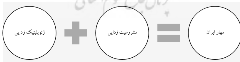
شکل ۱. ابعاد دوگانه جنگ هوشمند آمریکا علیه ایران

به نظر می‌رسد رویکرد جو بایدن برای مقابله با ایران مبتنی بر جنگ هوشمند است. در این جنگ ابتدا در بُعد سخت قدرت از یکسو تلاش می‌گردد تا توانمندی‌های نظامی و دفاعی ایران از برنامه‌های موشکی گرفته تا توان متعارف نظامی از راه اعمال تحریم‌های اقتصادی، فشار سیاسی و... محدود گردد و ایران در قالب معاهده‌ای همانند برجام توسعه برنامه‌های نظامی خود را متوقف سازد (رایت، ۲۰۲۱). از سوی دیگر بر ژئوپلیتیک‌زدایی تأکید می‌گردد تا مزیت‌های ژئوپلیتیک ایران نیز سلب گردد. در این پژوهش به جهت محدودیت نوشتاری صرفاً وجه اخیر بُعد سخت سیاست آمریکا مورد توجه قرار می‌گیرد. همچنین در بُعد قدرت نرم، از بین سیاست‌های مختلف تمرکز اصلی بر مشروعیت‌زدایی خواهد بود.