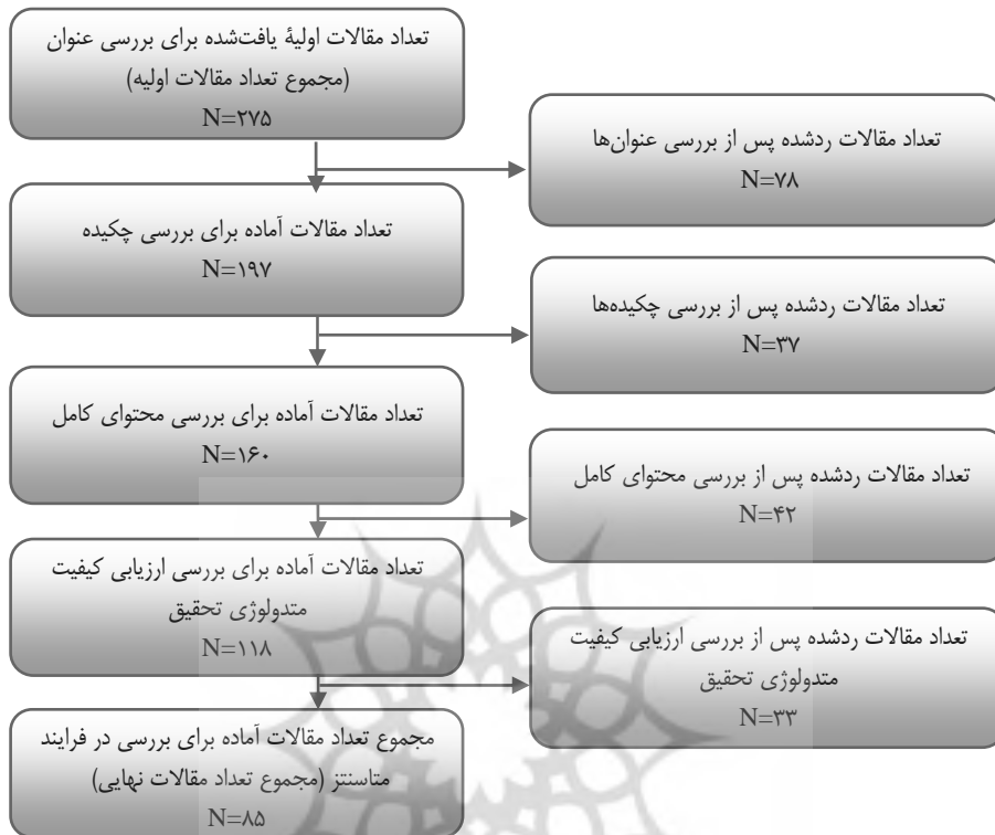
شکل ۱. خلاصه نتایج جست‌وجو و انتخاب مقالات مناسب

بر اساس تحلیل‌های صورت گرفته به کمک تحلیل محتوا روی ۸۵ مقاله نهایی انتخاب شده و با روش کدگذاری باز اشتراس و کوربین (شرایط علی، شرایط زمینه‌ای، شرایط مداخله‌گر، پدیده اصلی و ابعاد آن، اقدامات و پیامدهای حکمرانی خوب الکترونیک)، در مجموع ۶ مقوله، ۱۳ مفهوم و ۴۳ کد نهایی برای ابعاد مدل حکمرانی خوب الکترونیک، کشف و برچسب‌گذاری شدند. یافته‌های این مرحله نشان داد، در مطالعات قبلی چنین مطالعه نظام‌مندی انجام نگرفته و در هر یک از مطالعات، بی‌آنکه ابعاد چندگانه پدیده حکمرانی خوب الکترونیک به صورت پویا و نظام‌مند در نظر گرفته شود، فقط به جنبه خاصی از آن توجه شده است. نتایج این مرحله از تحقیق در جدول‌های ۳-۸ نشان داده شده است.