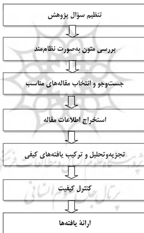
شکل ۲. گام‌های فراترکیب

برای تحقق هدف مورد نظر در این پژوهش، از روش هفت‌مرحله‌ای سندلوسکی و باروسو (۲۰۰۳، ۲۰۰۷) استفاده شده است که شکل (۲) خلاصه این مراحل را نمایش می‌دهد.