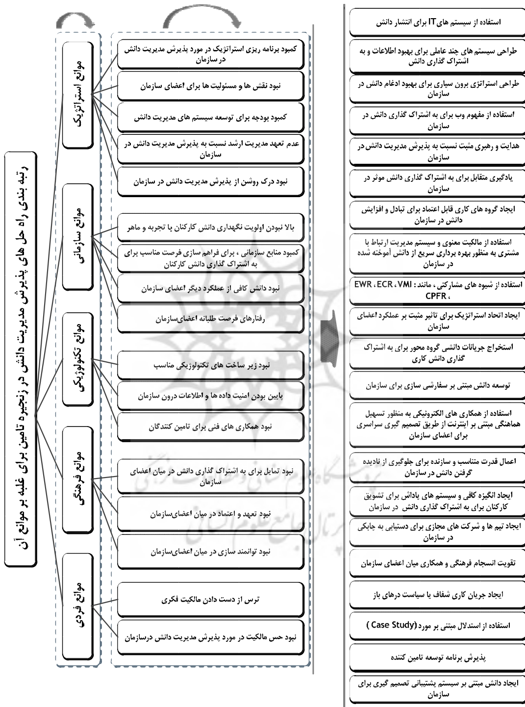
شکل ۱. ساختار شبکه‌ای تصمیم‌گیری برای رتبه‌بندی راه‌حل‌های غلبه بر موانع پذیرش مدیریت دانش در زنجیره تأمین

مرحله ۴. رتبه‌بندی راه‌حل‌های غلبه بر موانع پذیرش مدیریت دانش در زنجیره تأمین و تعیین رتبه نهایی با رویکرد VIKOR فازی. فرایند روش ترکیبی MADM فازی، در شکل ۲ نشان داده شده است.