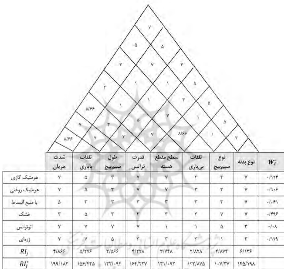
شکل ۳. تکمیل فرایند ماتریس خانه کیفیت

R_{ij} ، در ماتریس روابط خانه کیفیت، نشان دهنده رابطه و تأثیر هریک از انواع ترانسفورماتورهای ویژه بر طراحی الزامات فنی است. RI_k اهمیت نسبی k امین الزام فنی را نشان می‌دهد و T_{kj} نشان دهنده درجه همبستگی بین k امین و j امین الزام فنی در سقف ماتریس خانه کیفیت است. حاصل رابطه ۲ اهمیت نهایی پارامترهای فنی است.