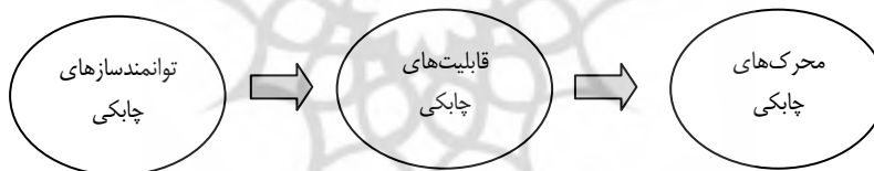
نمودار ۱. روابط بین محرک‌ها، قابلیت‌ها و توانمندسازهای چابکی

توانمندسازهای چابکی ابزارهای دست‌یابی به قابلیت‌ها هستند. این توانمندسازها باعث توسعه و بهبود قابلیت‌ها در سازمان می‌شوند. براساس طبقه‌بندی گوناسکاران، توانمندسازهای چابکی به چهار دسته استراتژی‌ها، سیستم‌ها، کارکنان و تکنولوژی‌ها طبقه‌بندی می‌شوند که در این پژوهش تمرکز اصلی بر استراتژی‌های چابکی است (Gunasekaran, 1998). در حوزه چابکی، مطالعات متعددی انجام شده که در ادامه به مطالعات مرتبط با پژوهش حاضر اشاره می‌شود. شریفی و ژانگ با مطالعه ادبیات چابکی، مصاحبه با مدیران صنعتی و نظرسنجی آزمایشی، مدل مفهومی اولیه را معرفی کرده، یک متدولوژی را برای دست‌یابی به چابکی در سازمان‌های تولیدی تنظیم کرده‌اند. این مدل مفهومی از سه بخش اصلی تشکیل شده که عبارتند از: محرک‌ها، قابلیت‌ها و توانمندسازهای چابکی. این دو پژوهشگر برای دست‌یابی به روشی جهت تعیین قابلیت‌ها و توانمندسازهای موردنیاز سازمان، با بررسی نحوه ارتباط میان محرک‌ها، قابلیت‌ها و توانمندسازها، یک مدل شبکه‌ای مناسب معرفی کردند که با شروع از محرک‌های چابکی به توانمندسازهای چابکی می‌رسد. این مدل به صورت نمودار شماره (۱) قابل نمایش است.