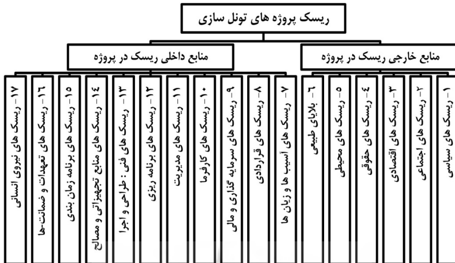
نمودار ۲. ساختار شکست ریسک پروژه‌های تونل‌سازی (۱۷ ریسک اصلی) [۳]

مرحله سوم: برای رفع محدودیت تعداد شاخص‌ها در روش کلاسیک، در اینجا ۶ شاخص تکمیلی دیگر پیشنهاد شده است. در این مرحله نظرات خبرگی به‌ازای هر یک از ریسک‌های ۱۷ گانه را جمع‌آوری کرده و با استفاده از روش میانگین وزین، میزان تجمیعی هر شاخص محاسبه شده است. در این راستا میزان تجمیعی شاخص اثرات اجتماعی اقتصادی (ASIR 1 ) طبق رابطه (۱۰) به‌دست می‌آید.