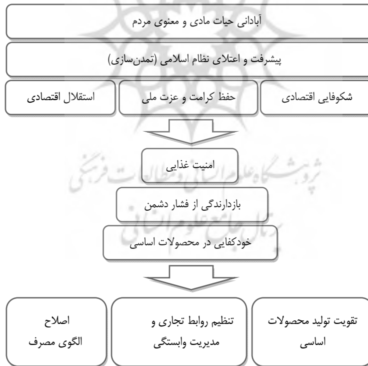
شکل ۳. درخت اهداف خودکفایی در محصولات اساسی

خودکفایی است. به بیان دیگر، اگرچه با توجه به ظرفیت‌های تولید کشاورزی ایران، افزایش تولید محصولات اساسی مختلف برای نیل به خودکفایی بسیار لازم است، اما کافی نیست. بر اساس یافته‌های پژوهش، «مدیریت وابستگی» (مهدی خواه، خانی جزنی، امامی و رمضان‌پور نرگسی، ۱۳۹۷: ۹۶-۹۷) و «اصلاح الگوی مصرف» دو راهبرد مکمل تولید برای تحقق خودکفایی است (شکل ۳). از یک طرف لازم است روابط تجاری کشور به‌گونه‌ای تنظیم شود که در کشورهای صادرکننده محصولات غذایی، نوعی وابستگی متقابل به محصولات کشور ما ایجاد شود، در انتخاب مبادی واردات و تنوع و تعدد آن دقت شود و همچنین با حضور فعال در منطقه و عرصه جهانی امکان تهدید دشمن را به حداقل برساند. از طرف دیگر، شایان توجه است که همه این تلاش‌ها برای تأمین نیاز مردم صورت می‌گیرد و این الگوی مصرف است که نیاز غذایی را ایجاد کرده است. از این رو، با جلوگیری از اسراف‌ها و مصرف مواد غذایی سالم و متناسب با شرایط اقلیمی کشور بسیاری از نیازهای کاذب از بین می‌رود. بنابراین برای خودکفایی در محصولات اساسی باید علاوه بر راهبرد تقویت تولید داخل، از راهبردهای دیگری نیز استفاده کرد. از ثمرات گسترده راهبردها این است که طراحی ختمش‌ها منعطف‌تر شده و امکان دستیابی به اهداف افزایش می‌یابد.