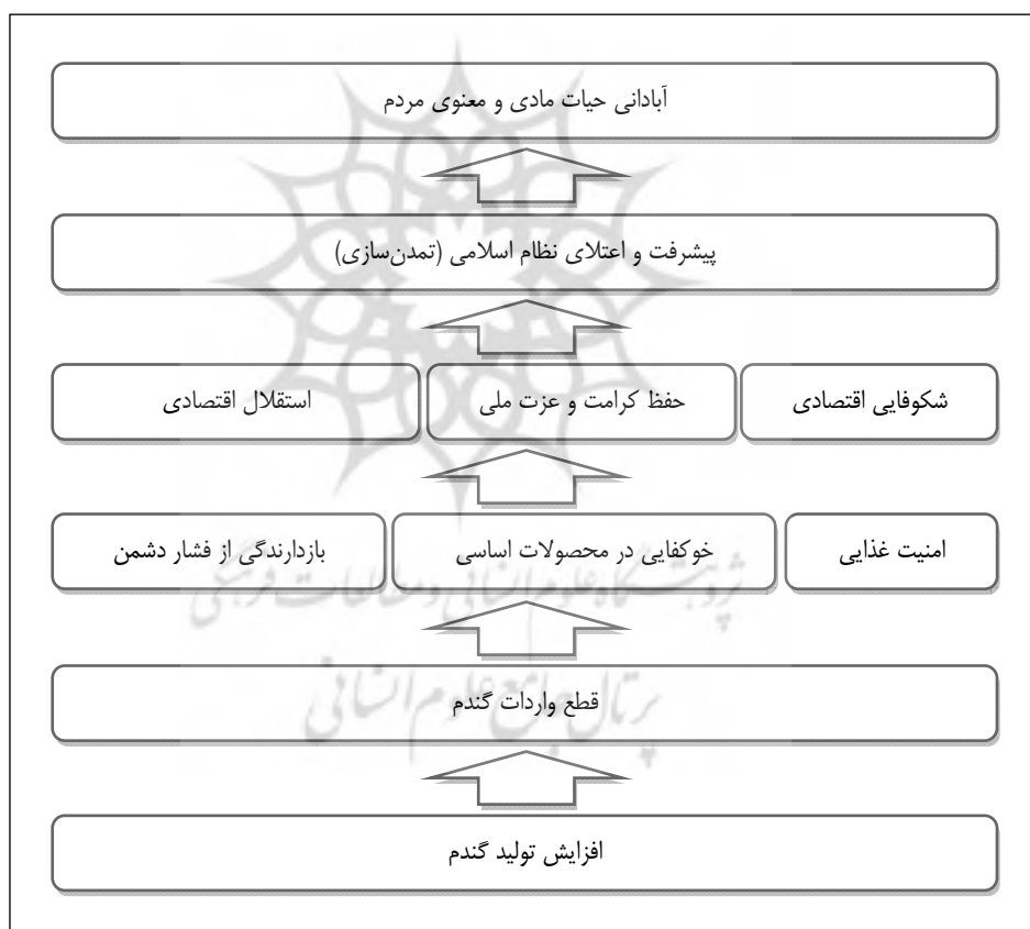
شکل ۲. نمودار وسیله - هدف خط‌مشی گندم

به «خودکفایی در محصولات اساسی، تأمین مایحتاج غذایی مردم، ایجاد بازدارندگی در مقابل فشار دشمن و به طور کلی امنیت غذایی کشور» را تسهیل می‌کند. پر واضح است و به طور مکرر از سوی رهبران انقلاب اسلامی تبیین شده است که «استقلال اقتصادی، حفظ کرامت و عزت ملی و نیز پیشرفت و شکوفایی اقتصادی کشور ما»، به «خودکفایی در محصولات اساسی کشاورزی و سایر نیازهای حیاتی کشور» نیاز دارد. از طرفی، «پیشرفت و شکوفایی اقتصادی» به خودی خود هدف نظام جمهوری اسلامی ایران نیست، بلکه به این دلیل مهم و مورد تأکید است که مؤلفه‌ای راهبردی در «پیشرفت و اعتلای نظام اسلامی و حرکت به سمت ایجاد تمدن نوین اسلامی» است؛ تمدنی که زمینه‌ساز «تعالی انسان‌ها و آبادانی حیات مادی و معنوی مردم جامعه» است. به این صورت روشن شد، «تولید گندم» به این دلیل مهم است که عنصری کلیدی در «پیشرفت کشور» است.