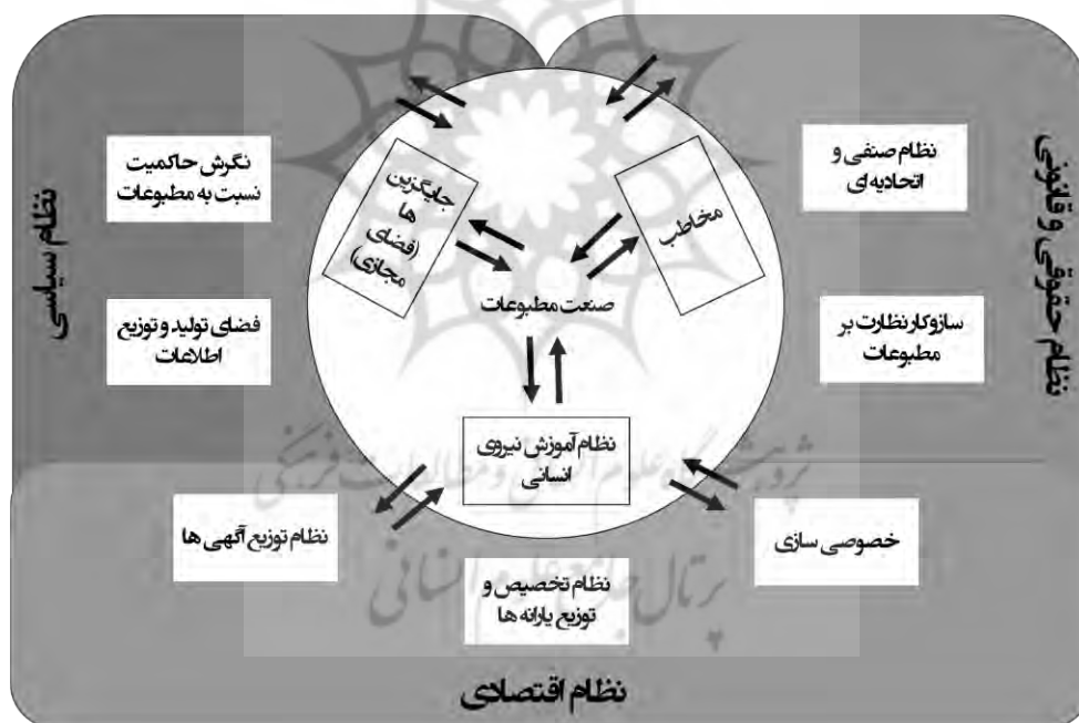
شکل ۳. زیست‌بوم مطبوعات کشور

در نهایت، ابعاد فوق به صورت زیست‌بوم صنعت مطبوعات ایران درآمد که در شکل ۳ صورت‌بندی شده است.