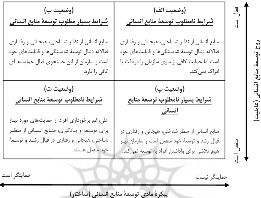
شکل ۱. ماتریس توسعه منابع انسانی: نقش دوسویه عاملیت و ساختار در توسعه منابع انسانی

فهم دوسویگی عاملیت و ساختار در توسعه منابع انسانی در قاموس نظریه ساختاری گیدنز، با در نظر گرفتن این دو عامل به‌عنوان دو نقطه مرجع استراتژیک، به ایجاد ماتریسی با چهار وضعیت مشخص منجر می‌شوند که آن را در این پژوهش «ماتریس توسعه منابع انسانی» می‌نامیم (شکل ۱). ماتریس توسعه منابع انسانی، در واقع نوعی الگوی تعاملی با استفاده از دو مرجع استراتژیک عاملیت و ساختار است، بنابراین، نوعی گونه‌شناسی محسوب می‌شود. گونه‌شناسی‌ها از انواع نظریه‌های توصیفی محسوب می‌شوند. بنیان نظریه‌های دیگر، بر نظریه‌های توصیفی استوار است و هنگامی مفید هستند که دانش اندکی درباره پدیده مورد مطالعه وجود دارد (دانایی فرد، ۲۰۱۰: ۱۴۸). با توجه به آنکه در مدل مفهومی ارائه شده، نقاط مرجع استراتژیک با اتکا به اصول نظریه‌های اقتضایی، در نظر گرفته شده است، می‌توان مدعی شد که ماتریس توسعه منابع انسانی، صرفاً توصیفی نبوده و از قدرت تبیین‌کنندگی و پیش‌بینی موفقیت یا شکست استراتژی‌های توسعه منابع انسانی در سازمان نیز برخوردار است. بنابراین مدل تعاملی ارائه‌شده در موضع فهم و توصیف خصیصه‌های توسعه منابع انسانی در سازمان از