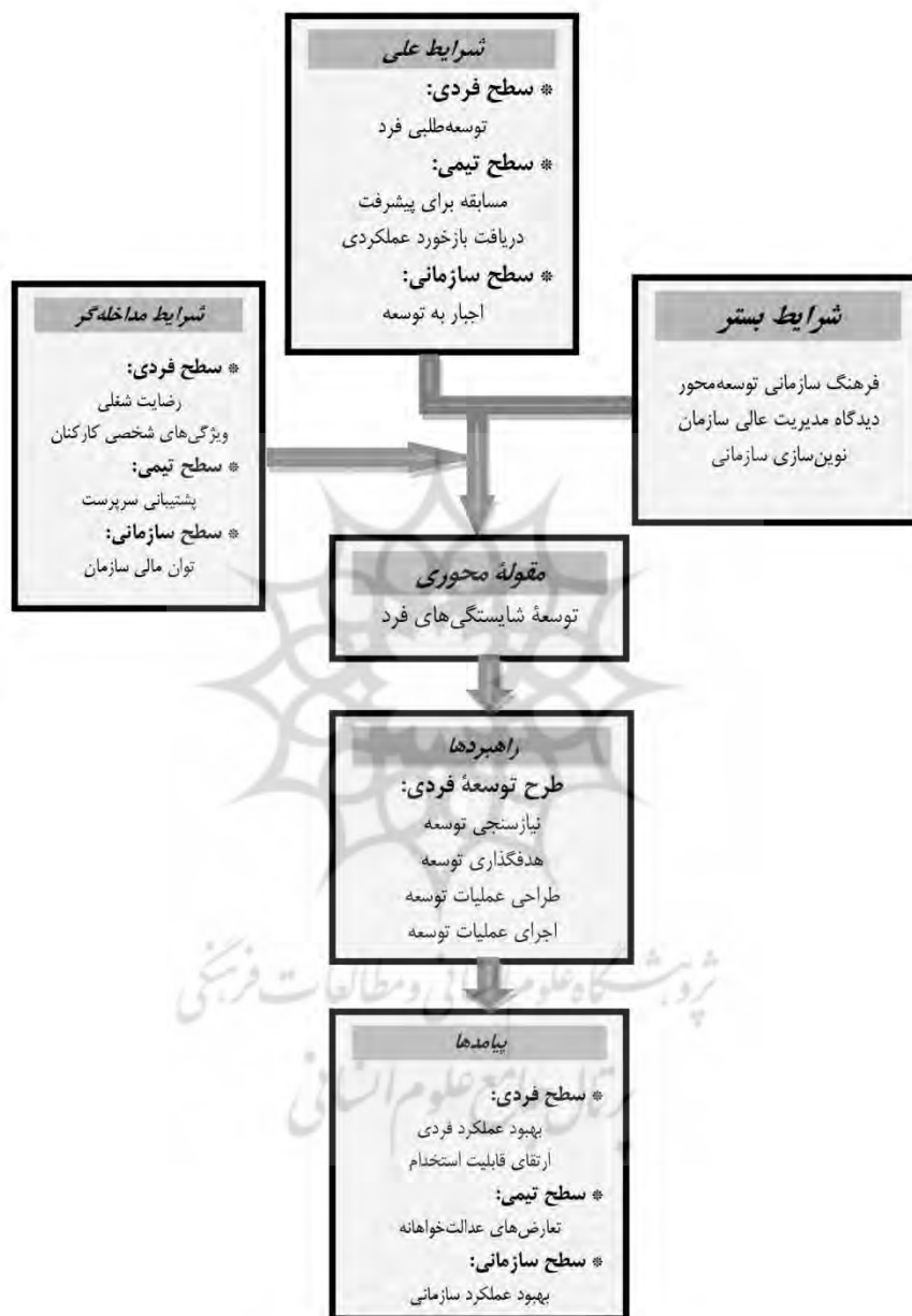
شکل ۲. مدل بارادایمی پژوهش