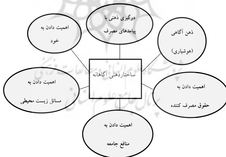
شکل ۲. ابعاد شناسایی شده برای ساختار ذهنی آگاهانه