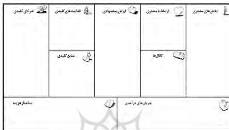
شکل ۱. بوم مدل کسب‌وکار استروالد و پینگر (۲۰۱۰)

دیگری مانند فعالیت‌ها، شرکا، منابع، محیط، هزینه و... را نیز در نظر گرفته و در مقایسه با سایر مدل‌های ارائه‌شده مدل کامل‌تری است، در این پژوهش مدل استروالد و پینگر (۲۰۱۰)، به دلیل کامل‌تر بودن به عنوان چارچوبی برای جای‌گذاری عوامل شناسایی‌شده تجارت اجتماعی استفاده شود و در نهایت مدل کسب‌وکاری مناسب در تجارت اجتماعی برای صنعت گردشگری ارائه می‌شود.