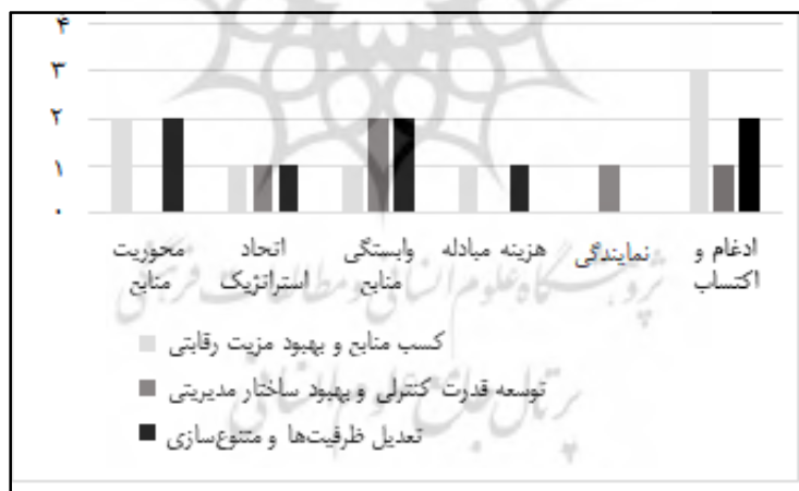
شکل ۱. وضعیت مضامین اشاره‌شده در نظریه‌های همکاری کسب‌وکار

نظریه هزینه مبادله بر شرایط عدم اطمینان در بازار اشاره دارد و بدین ترتیب یکپارچه‌سازی عمودی را ضروری برای دستیابی به هدف حداقل‌سازی هزینه‌ها می‌داند. در این نظریه به سلسله مراتب سازمان و یکپارچه‌سازی عمودی به‌صورت توأم در شرایط عدم اطمینان توجه شده است. در واقع، شناخت سلسله مراتب بازار می‌تواند هماهنگی لازم برای کاهش هزینه‌ها را در پی داشته باشد. محتوای این نظریه در مرتبه نخست بر کاهش بدهی‌ها و هزینه‌های شرکت اشاره دارد و در مرتبه دوم کاهش عدم اطمینان و تعدیل ظرفیت‌ها را در دستور کار قرار داده است.