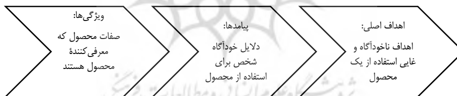
شکل ۱. شمای سلسله‌مراتب زنجیره‌های وسیله - هدف

شکل ۱ سلسله‌مراتب زنجیره وسیله - هدف را نشان می‌دهد. در این پژوهش نیز با هدف بررسی ویژگی‌های خرید اینترنتی در کشور و استخراج پیامدها و ارزش‌های این ویژگی‌ها بر اساس نظریه وسیله - هدف، استفاده از روش استخراج استعاره‌ای زالتمن (زیمت) ۳ راه حل مناسبی به نظر می‌رسد. محققان پیشین نیز از این روش برای شناخت زنجیره‌های وسیله - هدف استفاده کرده‌اند (برای مثال، زالتمن و کالتر، ۱۹۹۵؛ کریستنسن و اولسون، ۲۰۰۲ و ماری، ۲۰۱۴).