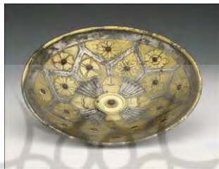
تصویر ۱: کاسه‌ای با طرح شبکه‌مانند، جنس: نقره و طلا، قدمت: سده نخست پیش از میلاد، محل کنونی: موزه پاول گتی؛

از آثار باقیمانده هنر فلزکاری دوران پارتی می‌توان به کاسه‌های نقره‌ای، ریتون‌های شیپوری‌شکل، ظروف سیمین و زرین و ... اشاره کرد. کاسه‌ای با طرح شبکه‌مانند (تصویر ۱) جنس این پیاله از نقره و همه سطح آن با طلا و سنگ‌های قیمتی منبت‌کاری شده است؛ منبت‌هایی که همگی تابع نظم و ترتیب هستند. به‌طور کلی این کاسه ۱۶ گل در اطراف و یک گل در وسط دارد که در تعداد گلبرگ‌هایشان با هم اختلاف دارند و از گونه‌های مختلفی هستند؛ رز، داوودی، شیپوری و ... در قسمت میانی این گل‌ها سنگ‌های قرمز عقیق درخشانی قرار گرفته‌اند که باعث زیبایی دوچندان این ظرف شده‌اند. این کاسه به‌صورت دایره‌ای است که قطر آن ۲۱ و ارتفاعش سه سانتیمتر می‌باشد و بسیار باظرافت و هنرمندانه ساخته شده است.