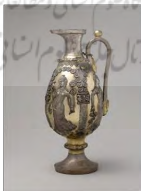
تصویر ۸: تنگ نقره زراندود ساسانی با نقش زنان رامشگر (آناهیتا) و کبوتر. قرن ۷-۱ میلادی. هدیه خانم و آقای سی داگلاس دیلون. موزه متروپولیتن. نیویورک؛ ( www.hermitagemuseum.org )

تنگ‌ها از نظر شکل بسیار متنوع هستند و اکثر آنها زراندود شده‌اند. به‌طور مثال تنگ‌هایی با بدنه گلابی شکل، دهانه دارای آبریز منقارمانند، دسته بلند با تزیین بالای دسته، پایه بلند حلقوی و یا قیفی شکل. همچنین تنگ‌هایی بدون دسته و پایه که دهانه آن ساده و بدون آبریز است و بر آنها نقوش متنوعی مانند حیوانات ترکیبی، زنان رقصنده، سایر نقوش مرسوم در دوره ساسانی ترسیم شده است (تصویر ۸)، (لک‌پور، ۱۳۷۵: ۱۱).