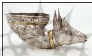
تصویر ۷: ریتون شیپوری شکل نقره زراندود. تکنیک: برجسته‌کاری از داخل، کنده‌کاری، سوزن‌کاری و طلاکاری. طول ۵۹۵۳ و ارتفاع ۱۹۵۹ و عرض ۱۳۵۱ و قطر دهانه ۱۳ سانتیمتر. قرن چهارم میلادی. کلکسیون آرتور ساکلر. واشنگتن دی سی؛ ( www.asia.si.edu )

ریتون‌ها ظروفی هستند که مانند لیوان برای آشامیدن مایعات از آنها استفاده می‌شد و به شکل مجسمه حیوان و یا انتهای آنها به شکل نیم‌تنه حیوان ساخته می‌شد. ساختن اینگونه ظروف از زمان‌های پیشین مرسوم بوده و نمونه‌های زیبایی از آن به شکل بزکوهی، قوچ و ... همراه با نقوش متداول این دوره در دست است (لک‌پور، ۱۳۷۵: ۱۱). در میان مجموعه گالری آرتور ساکلر یک نمونه کمیاب از ریتون ساسانی وجود دارد (گانتر و جت، ۱۳۸۳: ۴۴). ریتون شیپوری شکل با قسمت قدامی حیوان-مانند (تصویر ۷) یکی از چندین نمونه ظروف با پیشینه ایرانی است که متعاقباً و مکرراً در دوره ساسانی دیده می‌شود. مشخصه‌های فنی و سبک به کار رفته در این ریتون، از قبیل کاربرد طلاکاری نقطه‌ای و طرح سرتاسر هاشورخورده که نمایانگر پوست حیوانات است، از جمله ویژگی‌های ظروف نقره ساسانی است (همان: ۹۴).