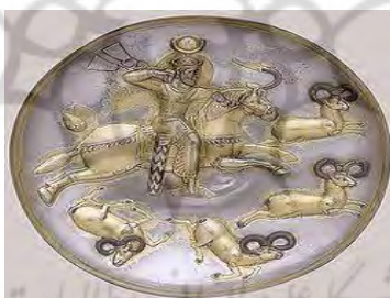
تصویر ۵: بشقاب سیمین زرانود با تزیین مینای سیاه. خسرو اول (۹۷۴-۹۴۱ م.) در حال شکار قوچ، قرن پنجم میلادی. موزه متروپولیتن. نیویورک، قطر ۵۵ سانتیمتر؛ ( www.metmuseum.org )

بشقاب‌ها: نقوش روی اکثر بشقاب‌های ساسانی ترسیم صحنه‌های شکار است. ساسانیان باور داشتند سلطنت ایشان مشیت الهی و جنبه الهی مسئولیت شاه از آن جهت بود که سلطنت، ودیعه خداوند و شاهنشاه، نایب خدا در زمین است. اینکه این قدرت آسمانی در وجود شخص شاه باقی است، از پیروزی او در شکار معلوم می‌شده و به این سبب تصویر کردن شکار شاهانه موضوعی مناسب برای کار هنرمندان در زمینه‌های گوناگون بوده است (پوپ و اکرم، ۱۳۸۷: ۱۷). در (تصویر ۵) شاه ساسانی در حال شکار قوچ می‌باشد. طرح بشقاب برای درباریان نشانه دلاوری و شکست‌ناپذیری شاهان ساسانی بوده است. این قبیل آثار برای هدیه دادن به پادشاهان کشورهای همسایه کاربرد داشته است. پادشاه در بشقاب دارای تاج و سر بند و همچنین گوی با پشتیبان مخصوص می‌باشد که هاله‌ای در اطراف سر او با مهره یا منجوق تزیین شده است. گمان می‌رود پادشاه در طرح بشقاب، پیروز یا قباد یکم باشد.