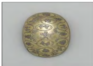
تصویر ۶: کاسه بیضی شکل سیمین زراندود ساسانی با اسلیمی نقش تاک سراسری، پرندگان و حیوانات. قرن ۷-۱ میلادی. موزه متروپولیتن. مجموعه فلچر؛ ( www.metmuseum.org )

ریتون‌ها ظروفی هستند که مانند لیوان برای آشامیدن مایعات از آنها استفاده می‌شد و به شکل مجسمه حیوان و یا انتهای آنها به شکل نیم‌تنه حیوان ساخته می‌شد. ساختن اینگونه ظروف از زمان‌های پیشین مرسوم بوده و نمونه‌های زیبایی از آن به شکل بزکوهی، قوچ و ... همراه با نقوش متداول این دوره در دست است (لک‌پور، ۱۳۷۵: ۱۱). در میان مجموعه گالری آرتور ساکلر یک نمونه کمیاب از ریتون ساسانی وجود دارد (گانتر و جت، ۱۳۸۳: ۴۴). ریتون شیپوری شکل با قسمت قدامی حیوان-مانند (تصویر ۷) یکی از چندین نمونه ظروف با پیشینه ایرانی است که متعاقباً و مکرراً در دوره ساسانی دیده می‌شود. مشخصه‌های فنی و سبک به کار رفته در این ریتون، از قبیل کاربرد طلاکاری نقطه‌ای و طرح سرتاسر هاشورخورده که نمایانگر پوست حیوانات است، از جمله ویژگی‌های ظروف نقره ساسانی است (همان: ۹۴).