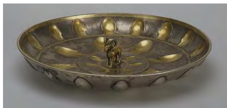
تصویر ۳: بشقاب با قوچی در وسط آن، جنس: نقره، قطر: ۲۳۴۱ سانتیمتر، قدمت: سده سوم م، منطقه جغرافیایی: قره چای، محل کنونی: موزه آرمیتاژ؛ (www.hermitagemuseum.org)