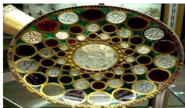
تصویر ۴: جام جم یا جام خسرو معروف به «تاس سلیمان»، (سده اول میلادی)، کتابخانه ملی پاریس موزه ببلیوتک ناسیونال؛ (گیرشمن، ۱۳۵۰: ۵۰۹)

مهم‌ترین آثار فلزی که از دوره ساسانی باقی مانده، ظروف نقره‌ای هستند که شماری از آنان زرانود شده‌اند. برخی از این ظروف نقره‌ای دارای خط‌نوشته هستند که بیان‌کننده نام صاحب ظرف و مشخصه وزن آن است (لک‌پور، ۱۳۷۵: ۱۰). به‌طور کلی ظروف نقره ساسانی در فرم‌ها و اشکال مختلفی ساخته شده که رایج‌ترین آنها عبارتند از: بشقاب‌ها، کاسه‌ها، ریتون‌ها، سینی‌ها و تنگ‌ها (توحیدی، ۱۳۸۶: ۴۴).