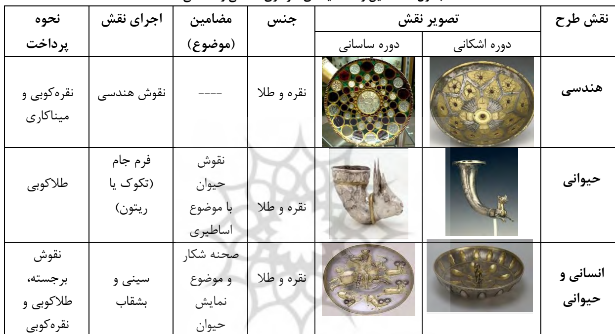
جدول ۱: مضامین و نقشمایه های فلز کاری اشکانی و ساسانی

میزان آثار مکشوفه از دوران اشکانی بسیار کم تر از ساسانی و در نتیجه محدوده مطالعاتی کم تری نسبت به دوران ساسانی وجود دارد؛ با این وجود به نظر می رسد، بیشتر آثار مکشوفه از این دوره تکوکها باشند. بیشتر نقشمایه های ظروف دوره اشکانی را گیاهی و هندسی و حیوانی در برمی گیرند. حال آنکه بیشتر آثار بدست آمده از دوران ساسانی بشقاب های مدور با موضوعات گوناگون می باشد که بیشتر این موضوعات را شکار شاهی در بردارند. جنس برخی ظروف فلزی دوره ساسانی از مفرغ (برنز) است؛ اما تاکنون ظرفی از جنس مفرغ در بین ظروف اشکانی نبوده یا حداقل در بین کارهای مورد مطالعه یافت نشده است. جنس اکثر ظروف دو دوره نقره زراندود و در برخی موارد به همراه تزییناتی از جنس شیشه و یا سنگ های قیمتی هستند. نقشمایه های مورد استفاده در هر دو دوره عبارتند از: نقشمایه های گیاهی؛ حیوانی؛ هندسی؛ انسانی.