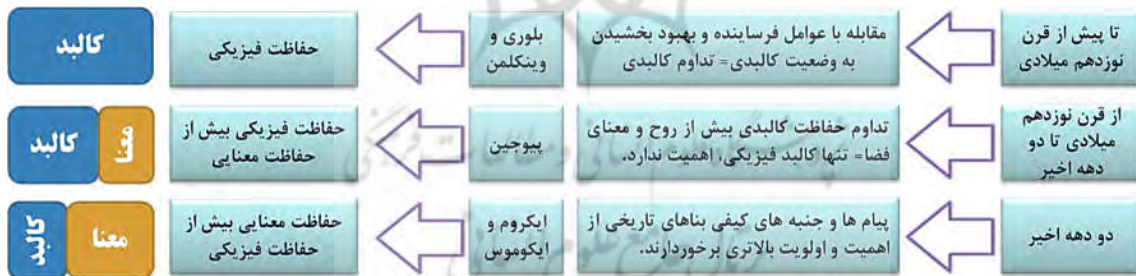
تصویر ۱. دیدگاه حوزه‌های حفاظت معماری در طول زمان (نگارندگان)

در چند دهه اخیر، مراکز بین‌المللی (یونسکو و ایکوموس) شکل گرفته که عهده‌دار مطالعه میراث فرهنگی، یادمان‌ها و محوطه‌های تاریخی و حفاظت از آنها هستند. با توجه به بررسی بیانیه‌ها، منشورها و قطع‌نامه‌های بین‌المللی در سه دهه اخیر (جدول ۱)، توجه به حفاظت مبتنی بر ارزش ۲ به صورت آشکار، رو به رشد بوده است (تصویر ۲).