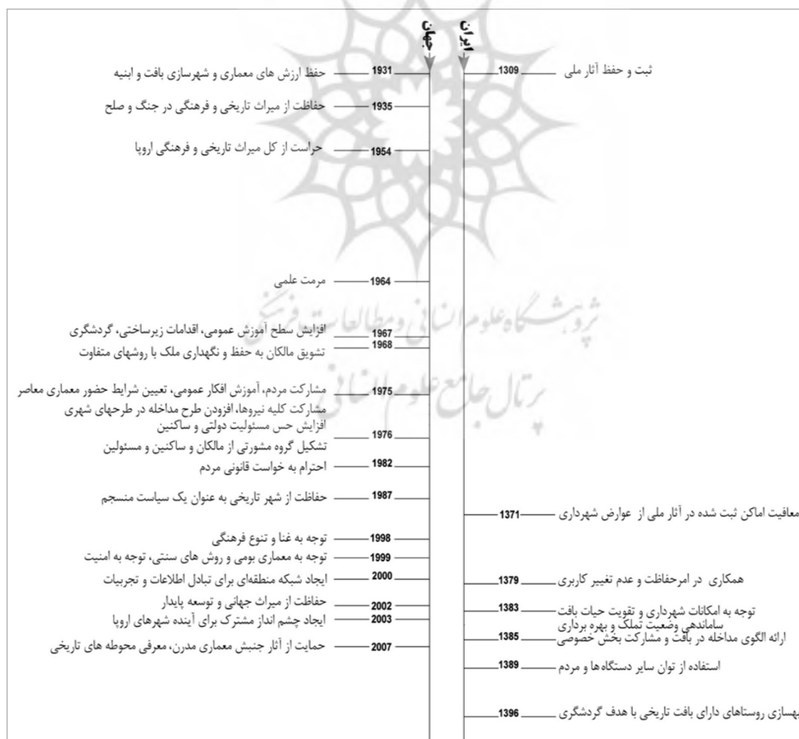
تصویر ۱. مقایسه بین رویکردهای اتخاذشده در منشور و قطع‌نامه‌های جهانی و قوانین مجلس شورای اسلامی ایران (نگارندگان)

داشته باشیم، می‌توان رویکردهای نظری زیر را عنوان کرد؛ یکی از این رویکردها، رویکرد "هم‌سویی حفاظت و توسعه" بوده که در بافت‌های تاریخی واجد ارزش حفاظت، مقدم بر توسعه لحاظ شده است (مهدیزاده و جاپلقلی، ۱۳۹۲). رویکرد "مشارکت در مستندسازی"، دستیابی به مفاهیمی ارزشمند برای مداخلات و تصمیمات آینده را حائز اهمیت می‌داند (رضویان و همکاران، ۱۳۹۴: ۴۸۸). در این رویکرد، به نقش شهرداری‌ها، حضور و مشارکت مردم، ایجاد حس تعلق و تولید خاطرات جمعی در بین ساکنین، توجه ویژه شده است. مسائل اقتصادی، اجتماعی و فرهنگی در بافت تاریخی، در "رویکرد معیشتی-اقتصادی" مطرح بوده که کاهش فاصله این بافت‌ها با دیگر مناطق شهری را مورد توجه قرار داده‌اند. در واقع می‌توان عنوان کرد که زمینه اصلی حیات در یک بافت تاریخی، رونق اقتصادی آن است. تنزل‌های اجتماعی عمدتاً به دلیل زوال اقتصاد سنتی در بافت‌های تاریخی هستند.