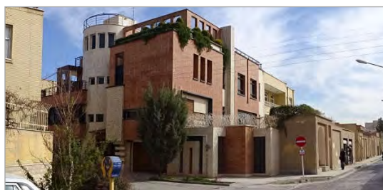
هماهنگی با محوریت نوآوری

تصویر ۲. تصاویر مربوط به جلفا با بیشترین امتیاز از رویکردهای چهارگانه (نگارنده)