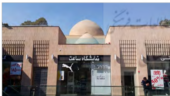
هماهنگی با محوریت تاریخی

نمونه‌گیری تصادفی، شیوه نمونه‌گیری در پژوهش حاضر است. حجم دقیق نمونه، با استفاده از فرمول کوکران ۲ و پس از انجام مطالعه مقدماتی و برآورد اولیه تخمین زده شد. از ابتدا، معیارهای دسترسی به نمونه‌ها چنان تعریف شده که آنها را محدود نموده و تمامی موارد، کل واحدی را تشکیل