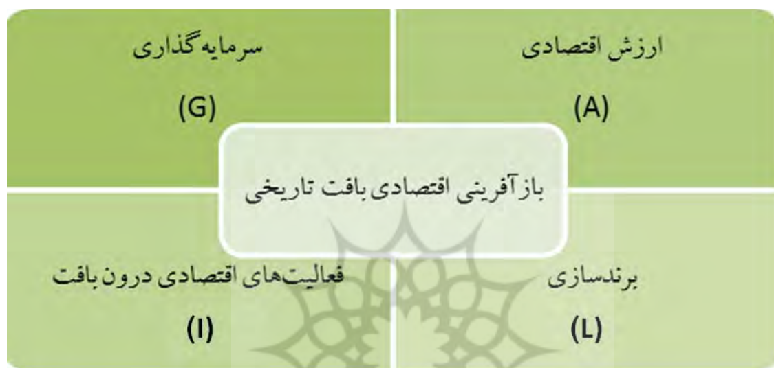
تصویر ۲. مدل بازآفرینی اقتصادی بافت تاریخی بر اساس نظریه کارکردگرایی ساختاری (نگارندگان)