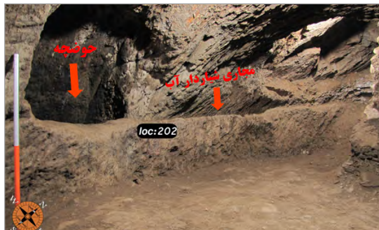
تصویر ۱۰. مجرای آب منتهی به حوضچه در دیواره غربی فضای شماره ۳ کارگاه شماره ۳ (نگارندگان)

همان‌طور که تشریح گردید در مجاورت غربی محوطه شاهد رودخانه نسبتاً دائمی و پرآبی هستیم که همانند بسیاری از محوطه‌های باستانی در دوره‌های پیش‌ازتاریخی، تاریخی و اسلامی، عامل بسیار مهمی در شکل‌گیری این محوطه و ایجاد فضاهای دست‌کند مجموعه بوده است.