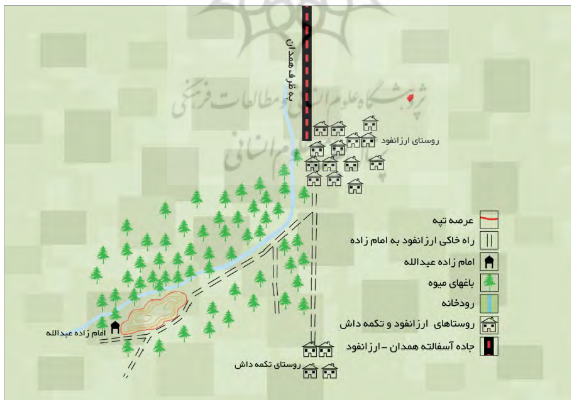
تصویر ۳. موقعیت قرارگیری محوطه نسبت به رودخانه واقع در مجاورت غربی مجموعه آثار معماری دست‌کند (نگارندگان)

حلقه چاه‌های یادشده در بالا از طریق کانال‌هایی (کوره) با همدیگر مرتبط می‌شوند. این کانال‌ها دارای ارتفاع ۹۰ تا ۱۳۰ سانتیمتر و عرض ۵۰ تا ۷۰ سانتیمتر است. کانال دارای سقفی قوس‌دار و کفی تقریباً مسطح است. در دیواره کانال اثرات کلنگ به خوبی مشهود است. لازم به ذکر است که در دیواره این کانال‌ها حفره‌هایی مشهود است که به نظر می‌رسد در زمان کندن و ایجاد کانال محل قرار دادن پیه‌سوز