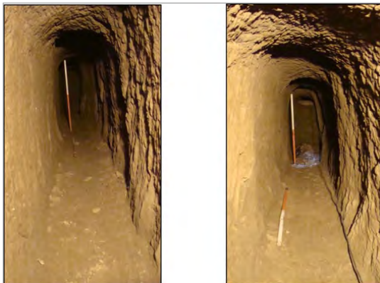
تصویر ۷. کانال‌های ارتباطی بین حلقه چاه‌ها (نگارندگان)

بوده است. همچنین ارتباط فضاها با کانال‌ها از طریق همان حلقه چاه‌ها امکان‌پذیر است (تصاویر ۵ و ۶ و ۷).