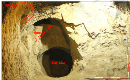
تصویر ۹. وضعیت قرارگیری حلقه چاه، مجرای آب و حوضچه در فضای شماره ۲ کارگاه شماره ۵