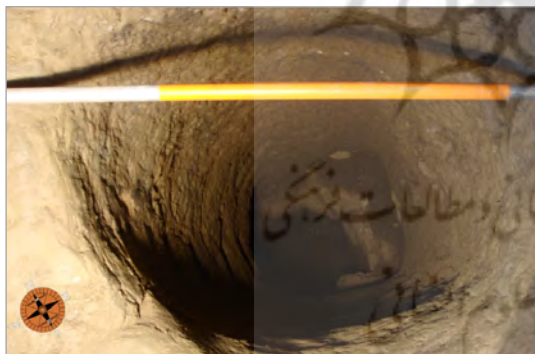
تصویر ۶. حلقه چاه در کف فضای شماره ۲۹ کارگاه شماره ۵