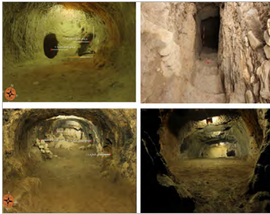
تصویر ۴. نمایی از ورودی و فضاهای زیرزمینی دست‌کند مجموعه