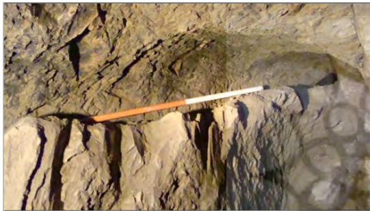
تصویر ۸. مجاری آب ایجادشده در دیواره فضاها

در برخی از فضاهای این مجموعه چندین حوضچه در مجاورت یک حلقه چاه قابل مشاهده است که از طریق روزنه‌ای به همدیگر وصل هستند. پس از پر شدن حوضچه اول، دومی و سپس سومی پر می‌شده که از این طریق علاوه بر ذخیره آب می‌توانستند آب موجود در فضاها را تصفیه نمایند و املاح موجود در آب را ته‌نشین نمایند. در برخی موارد حلقه چاه‌های منتهی به کف فضاهای این مجموعه دارای لبه و شیاری هستند که محلی برای تعبیه درپوش حلقه چاه محسوب می‌گردیده است. بدین منظور از تخته‌سنگ‌های صاف و قطور برای این موضوع استفاده می‌گردیده که حکم درپوش را داشته و همین موضوع مانع آلودگی آب شده و