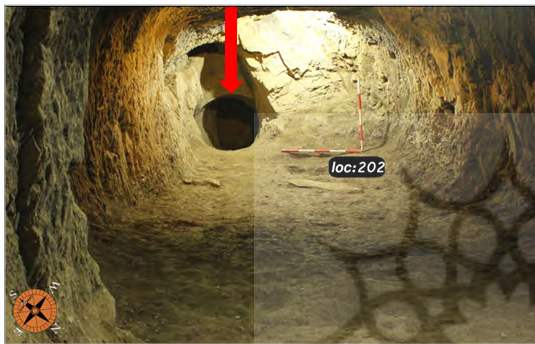
تصویر ۵. وضعیت قرارگیری حلقه چاه (منتهی به کانال و سطح محوطه) در انتهای فضای شماره ۲ کارگاه شماره ۵ (نگارندگان)