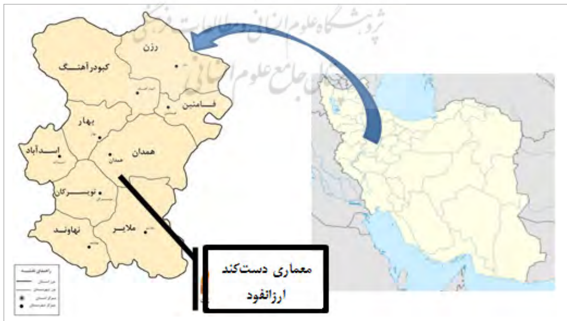
تصویر ۱. موقعیت قرارگیری مجموعه آثار معماری دست‌کند ارزانفود (نگارندگان)

آب، بر پایه باورهای اساطیری ایران باستان، دومین آفریده مادی است که اورمزد در گاهنبار دوم از گاهنبارهای آفرینش