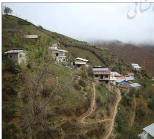
تصویر ۲. سازمان فضایی خانه‌های کوهستانی، روستای نیچکوه، مازندران