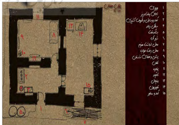
تصویر ۳. روستای نیچکوه، مازندران، پلان یک خانه ساده روستایی (نگارندگان)