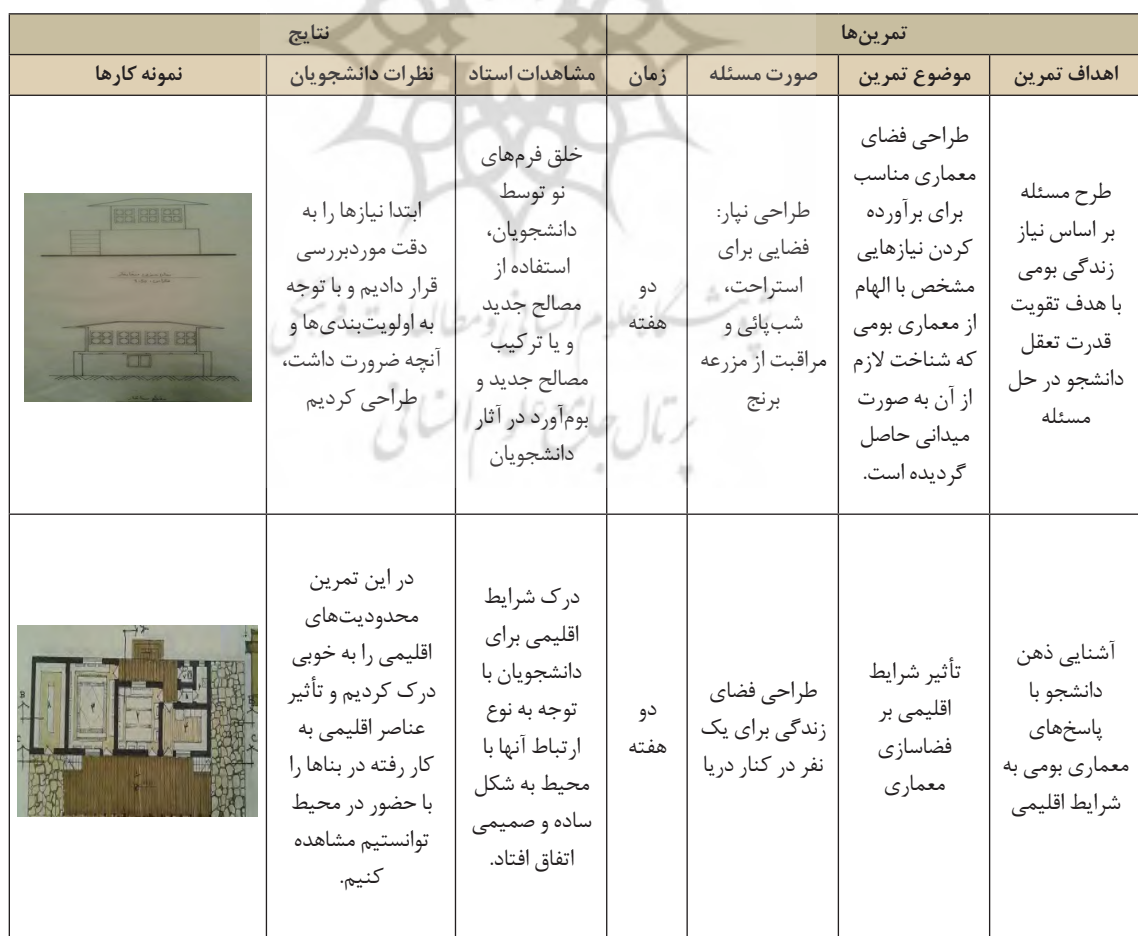
جدول ۱. نتایج حاصل از برگزاری تمرین‌ها

معماری بومی مازندران سرشار از خلاقیت ساکنان و به وجود آورندگان آن است. خانه‌ها در عین مشابهت‌های بسیار، یکسان نیستند. فرق خانه‌ها گاه در شکل زمین و گاه در شیب و ناهمواری‌های آن است. این نوآوری تنها در فرم‌ها و اشکال نیست، بلکه در نحوه ترکیب فضاها، در اندازه، در هندسه و ... ظهور پیدا می‌کند. تمامی مراحل طراحی و اجرا در معماری بومی مازندران از فراهم آوردن مصالح و آماده سازی آن تا ساخت بنا همگی گویای میزان بالای خلاقیت و نوآوری در حل مسائل است. یافته‌های تحقیق نشان می‌دهد که مصادیق حل مسئله اشاره‌شده در معماری بومی مازندران کاملاً منطبق با سرفصل دروس پایه معماری است و از طریق طراحی تمرین‌هایی هدفمند که هم منطبق با اهداف سرفصل دروس پایه معماری باشند و هم از دل آموزه‌های معماری بومی برخاسته باشند؛ می‌توان دانش و خلاقیت موردنیاز دانشجویان دروس مقدمات طراحی معماری برای حل مسائل را ارتقاء بخشید.