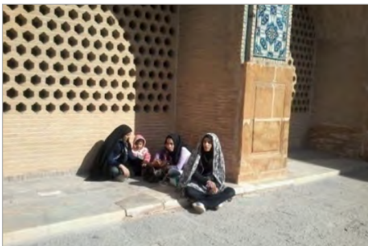
تصویر ۷. ایوانچه‌های ضلع شمالی که برای افراد حاضر در آن تشکیل یک قلمرو می‌دهد (نگارندگان، ۱۳۹۳)