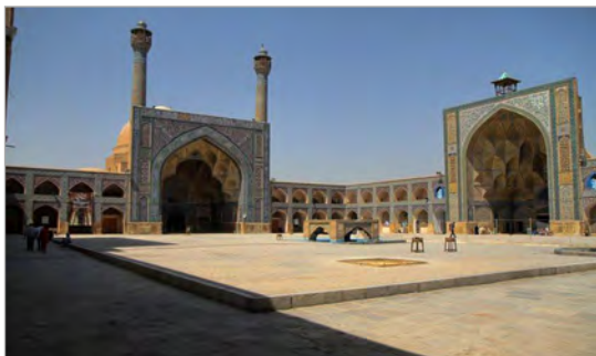
تصویر ۲. ایوان غربی (سمت راست) و جنوبی (سمت چپ) مسجد جامع (عتیق) اصفهان (نگارندگان، ۱۳۹۲)

جهت بررسی علل و نوع رفتارهای به وقوع پیوسته در مسجد جامع (عتیق) اصفهان، از میان دو نوع روش پژوهشی اصلی در روانشناسی (اکتشافی و فرضیه)، نوع فرضیه و از میان دو روش اصلی اثبات فرضیه (پژوهش میدانی و پژوهش آزمایشگاهی) پژوهش میدانی انتخاب گردید و از میان روش‌های مختلف پژوهش میدانی، از روش «مشاهده» و «پرسشنامه» استفاده شده است. در روش «مشاهده»، دو فن «تهیه فهرست رفتاری ۱۶ » و «تهیه نقشه رفتاری ۱۷ » و در روش «پرسشنامه»، دو فن «فتراق معنایی ۱۸ » و «اخذ تصویر (نقشه) ذهنی ۱۹ » برای دریافت معنای نقش بسته از فضا و بنا در ذهن استفاده‌کنندگان به کار رفته است. متغیرهای مداخله‌گر شامل سه عامل اصلی «سن»، «جنس» و «هدف حضور در بنا» هستند که مدنظر قرار گرفته‌اند. پرسشنامه از ۹۰ نفر از استفاده‌کنندگان که به صورت اتفاقی ساده گزینش شدند، اخذ شد که ۸۶ پرسشنامه فتراق معنایی و نقشه ذهنی قابل‌بررسی بودند. از نظر هدف حضور در بنا، ۴۰ نفر گردشگر، ۴۶ نفر عبادت‌کننده و از نظر جنسیت و سن، ۳۲ نفر زن، ۵۴ نفر مرد، ۲۲ نفر کودک، ۳۰ نفر جوان، ۱۶ نفر میان‌سال و ۱۸ نفر کهن‌سال جامعه آماری را