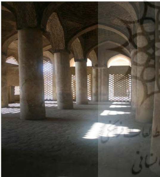
تصویر ۵. شبستان شمالی مسجد جامع (عتیق) اصفهان (نگارندگان، ۱۳۹۳)

که این مسأله می‌تواند به علت تناسبات نزدیک به یک (نسبت طول به عرض در پلان واحدهای فضایی) در اکثر فضاها و رنگ آرامش‌بخش آبی ۲۴ فیروزه‌ای در کاشی‌کاری‌ها و کاربرد خشت و گل و آجر در بنای مسجد که منجر به خاطره‌انگیز بودن آن می‌شود، باشد. ضمن این که روابط معنادار بین صفات نشان می‌دهد که از دید استفاده‌کنندگان، بنا هرچه «خاطره‌انگیزتر» باشد «آرامش» بیشتری دارد. پرسشنامه‌ها نشان می‌دهند که مسجد از دید استفاده‌کنندگان «دلپذیر» است. روابط معنادار بین صفات نشان می‌دهد که بین صفات «دلپذیر» و «روشن» و «دلپذیر» و «پرنور» ارتباط برقرار است؛ از این رو می‌توان گفت حیاط وسیع مسجد (که استفاده‌کنندگان بیشترین حضور را در آن دارند) و پرنور بودن از ویژگی‌های آن است، منجر به پدید آمدن معنای دلپذیری از معماری مسجد در استفاده‌کنندگان می‌شود.