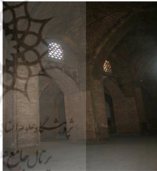
تصویر ۴. شبستان جنوبی مسجد جامع (عتیق) اصفهان (نگارندگان، ۱۳۹۳)