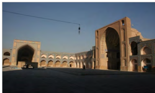
تصویر ۱. ایوان شرقی (سمت راست) و شمالی (سمت چپ) مسجد جامع (عتیق) اصفهان (نگارندگان، ۱۳۹۲)