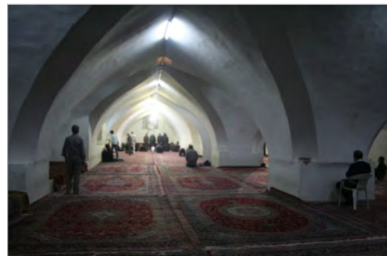
تصویر ۶. شبستان بیت‌الشتاء در مسجد جامع (عتیق) اصفهان