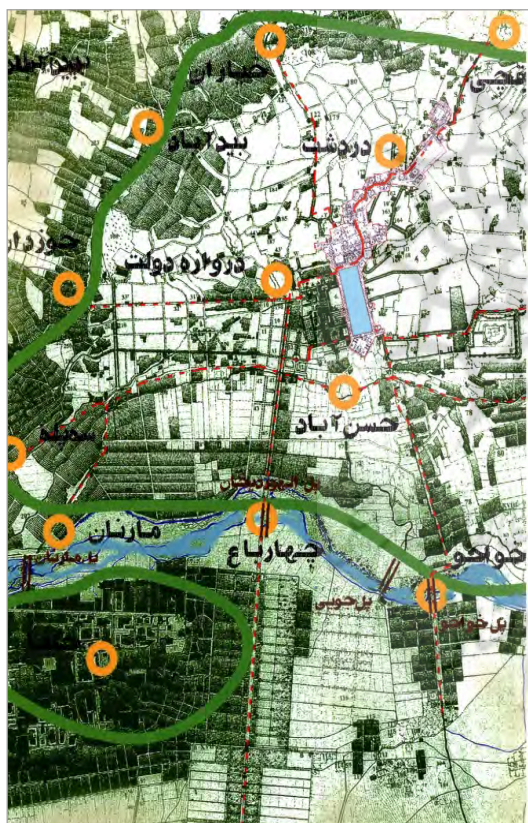
تصویر ۲. شهر اصفهان و باغات دوره صفوی روی نقشه چریک (عمرانی، ۱۳۸۴)

در زمان به حکومت رسیدن صفویان، اصفهان شهری ساخته شده و آباد بود و روی دشتی به نسبت صاف با شیبی حدود ۳ درصد به طرف شمال شرقی قرار داشت. علت توسعه شهر در طی قرون متمادی به سمت جنوب غربی را برخی، فراوانی آب در بخش‌های بالادست و هوای مناسب‌تر حاصل از آن دانسته‌اند. زیرا آب و هوای اصفهان هر دو از سوی غرب به شرق جریان دارند و در نتیجه، امکانات زیست مناسب‌تری را در این جهت فراهم آورده‌اند. بنابراین، یکی از ویژگی‌های طرح صفوی طراحی در زمین باز حاشیه جنوبی شهر قدیمی بود که عمدتاً از مزارع و باغات تشکیل می‌شد. همچنین، ضمن دوری جستن از محدودیت‌های مالکیت و مشکلات تراکمی شهر قدیمی، پیوند زمین‌های حومه‌ای و ضلع جنوبی رودخانه به پهنه شهری بود.