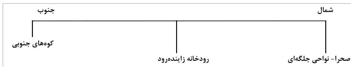
تصویر ۱. استعداد منظر و توان اکولوژیک شهر اصفهان (نگارندگان)