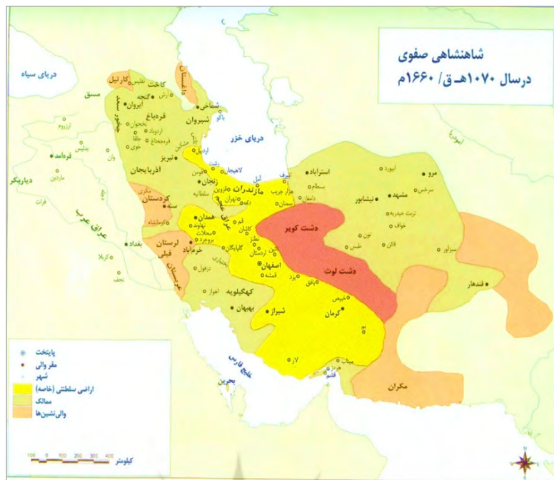
تصویر ۶. نقشه ایران دوره صفوی با اراضی خاصه و ممالک (بابایی و دیگران، ۱۳۹۰)

زیرا در اعمال هندسی و دقایق کار، هریک چون مرکز پرگار، دم از تفرد و یکتایی می‌زدند (منشی، ۱۳۸۷). نیروی کار غیرماهر که بخش زیادی از توان اجرایی طرح صفوی به حساب می‌آمد، از طریق مشارکت مردمی تأمین می‌شد. بخش متعارفی از مالیات‌های مردم به حکومت و همین‌طور اجرای پروژه‌های ساختمانی بزرگ، در فصلی که کشاورزی نبود همه را به‌نوعی در پروژه‌های عظیم دولتی درگیر می‌کرد. بدین ترتیب در طرح توسعه اصفهان، مردم حس تعلق به شهر و حکمرانشان را با مشارکت در پروژه‌های ساختمانی گسترش می‌دادند. کارگرهای عامی، به تلاش‌های شان مباحثات می‌کردند و بنا بر این، نمی‌شود گفت که در سازماندهی کار برای سیستم‌های ساختار کهن اجباری در کار نبود.