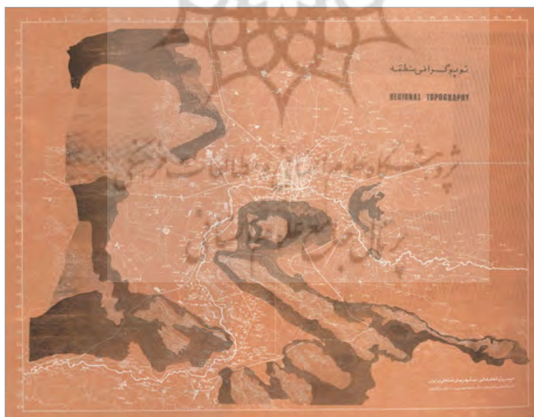
تصویر ۴. وضعیت توپوگرافی منطقه اصفهان (طلایی مینایی، ۱۳۴۶)

خدمات و بازرگانی به‌کار گرفته می‌شوند. درون شهر و پشت دیوارهای نه‌چندان محکم آن، کشاورزی صورت می‌گیرد و در روستاهای مملو از باغات توت، صنعت ابریشم پای می‌گیرد، ایل به تولید و باز تولید دام می‌پردازد و بنابر نیاز در صنایع، نساجی نقش برعهده می‌گیرد. وحدت اجتماعی کار درون دولت قاهر مرکزی بار دیگر مهر و نشان خود را بر شیوه‌های زیست و تولید کشور می‌زند. دولت صفوی بنابر سنت‌های کهن، سازماندهی، راه‌اندازی و ایجاد تأسیسات و تجهیزات زیرساختی را عمدتاً برعهده می‌گیرد. سرمایه‌گذاری‌های عظیم دولت در امور و تأسیسات و تجهیزات زیرساختی سبب می‌گردد تا شهرگرایی و شهرنشینی رونقی دوچندان یابد. بدین ترتیب، ساخت عناصر خدماتی و تأسیسات شهری به اوج خود می‌رسند. مجموعه‌های بی‌شماری در شهرها ساخته می‌گردند که تاکنون باقی‌مانده و عناصر اصلی شهرسازی و شهرنشینی سنتی شناخته می‌شوند. شهر در این دوره آلیاژی است از فعالیت‌های کشاورزی، صنعتی و بازرگانی، درعین آنکه مقر دیوانی و حضور دولت نیز هست. چنین آلیاژی در روزگاران کهن هم وجود داشت ولی هیچ‌گاه به قاعده‌ای کلی چون عهد صفوی تبدیل نشده بود (حبیبی، ۱۳۸۷: ۹۱-۹۰).