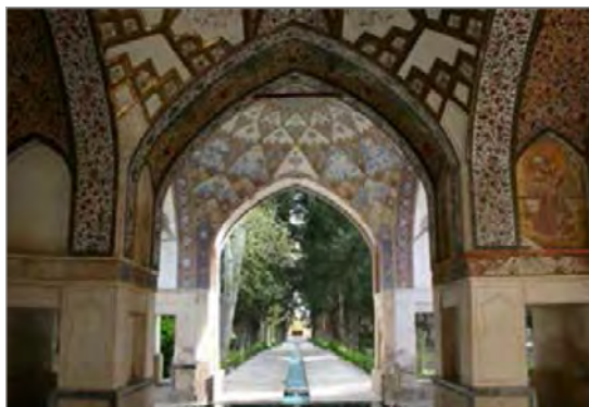
تصویر ۹. بخشی از فضای داخلی شتر گلو در باغ فین کاشان.

نمونه دیگر، گنبد سلطانیه با دارا بودن طیف وسیعی از تزیینات معماری است که طبیعتاً انتظار می‌رود بخشی از متن سند