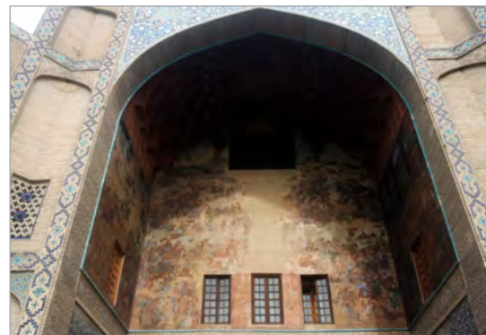
تصویر ۸. نقاشی‌های تمپرای سردر قیصریه با موضوع حمله ازبک‌ها، قرار گرفته در ضلع شمالی میدان نقش جهان اصفهان (نگارندگان).