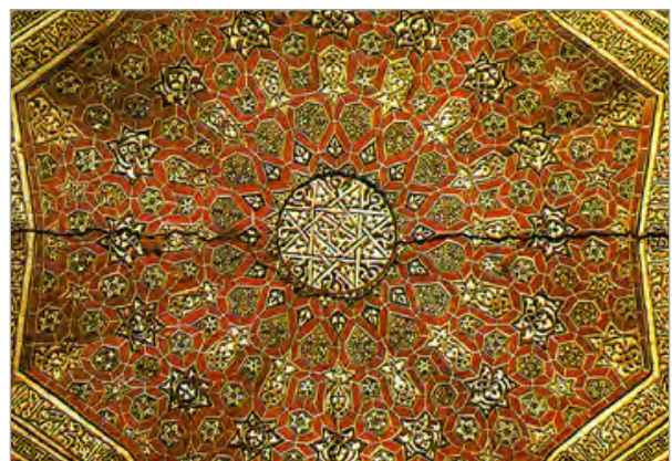
تصویر ۱۱. نمونه ای از عناصر تزئینی بنای سلطانیه.