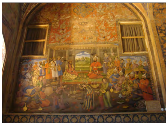
تصویر ۱۰. بخشی از دیوارنگاره‌های یادمانی و پرشمار صفوی در کاخ چهلستون (نگارندگان).