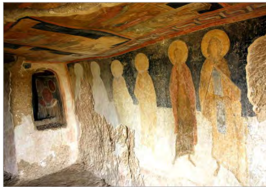
تصویر ۶. دیوارنگاره‌های موجود در یکی از دخمه‌های دره رودخانه رونسکی