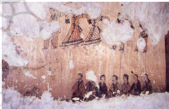
تصویر ۴. نمونه‌هایی از دیوارنگاره‌های موجود در مقابر پادشاهی کایورو