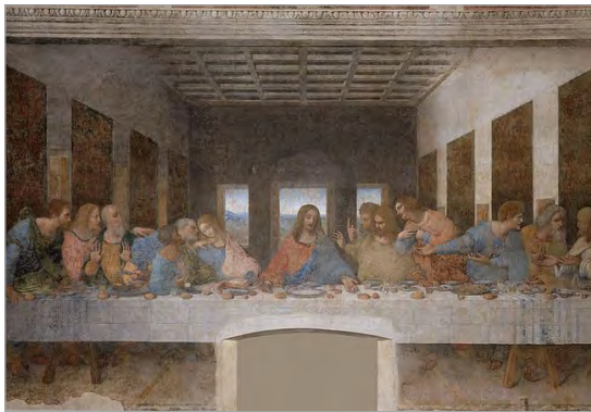
تصویر ۷. نقاشی شام آخر، ۱۴۹۸-۱۴۹۵، تمپرا و تکنیک‌های مختلف بر اندود. ۴۶۰ × ۸۸۰ سانتی متر، صومعه سانتا ماریا delle Grazie، میلان

آخرین نمونه این بخش، کلیسا و صومعه سانتا ماریا دل گرازی ۲۵ است که یکی از معروف‌ترین شاهکارهای دنیا، دیوارنگاره شام آخر، اثر لئوناردو د/وینچی را در خود دارد. این اثر به لحظه‌ای اشاره می‌نماید که مسیح میان حواریون می‌گوید: «یکی از شما هویت مرا آشکار خواهد کرد.» درواقع، هنرمند احساسات شخصیت‌ها را در زمان شنیدن سخن مسیح کاملاً رسا به تصویر کشیده‌است. در مدارک ثبتی این بنا پس از بیان مفصلی درباره دیوارنگاره‌اش، به ویژگی‌های دیگری همچون سازه گنبد مرتفع آن اشاره شده‌است. از آنجایی که این اثر جزء اولین بناهایی بوده که به ثبت جهانی یونسکو رسیده‌است، در مدارک موجود نمی‌توان براساس معیارهای رایج فعلی در ثبت جهانی، برآوردی که بتواند اهمیت این دیوارنگاره را از دید امروز یونسکو به تصویر بکشد، فراهم ساخت. اما آنچه مسلم است در پرونده ثبت میراث جهانی این اثر، ردپای ارزش دیگری آشکارا مشاهده می‌گردد که همان ارزش زیبایی‌شناسانه اثر جدای از افسانه‌هایی است که به آن نسبت داده‌اند (Ralista, 2010)، (تصویر ۷). برای انسجام‌بخشی مطالب این بخش، مواردی که در پرونده‌های ثبت جهانی آثار خارج از ایران به عنوان شاخصه‌های ارزشی دیوارنگاره‌ها یادشده، در جدول ۲ بطور خلاصه ارائه شده‌است.