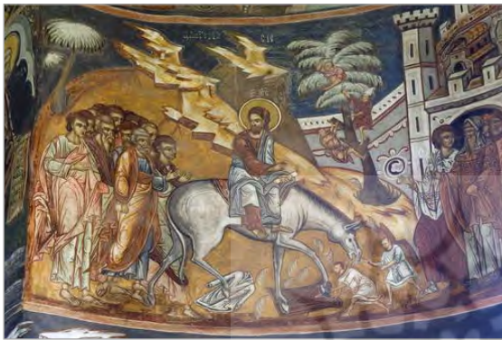
تصویر ۳. بخشی از دیوارنگاره‌های موجود در فضای داخلی کلیسای سنت جورج صومعه Voronet سابق (http://whc.unesco.org/en/list/598/gallery/).

در دره رودخانه روسنسکی ۲۲ در شمال شرق بلغارستان نیز، مجموعه‌ای از کلیساها به شکل دخمه‌های کنده‌شده کوچک، صومعه‌ها و سلول‌های توسعه‌یافته در مجاورت روستای ایوانوو ۲۳ وجود دارد. اینجا نخستین محلی است که اولین زاهدان گوشه‌نشین، سلول‌ها و کلیساهای خود را طی قرن دوازدهم میلادی در آنجا حفر کردند. نقاشی‌های دیواری