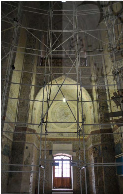
تصویر ۱۲. فضای داخلی عمارت سلطانیه که سراسر با عناصر تزئینی آذین شده است (نگارندگان).

۳. از منظر تاریخ آفرینش اثر، دارای طول عمر قابل توجهی باشد؛ آنچه ویژگی حاضر را از مورد قبلی متمایز می سازد، این است که طول عمر به تاریخ تولد دیوارنگاره نظر داشته و نه به اثرات متقابل زمان و دیوارنگاره در طی سالیانی که از زندگی اثر می گذرد. ریشه طرز فکر قدمت ارزش بیشتر را بایستی در نهاد انسان و شکل رابطه او با زمان دانست. شاید بتوان ادعا کرد، از آنجاکه بشر نتوانسته بر زمان تسلط یابد و آن را در کنترل خود