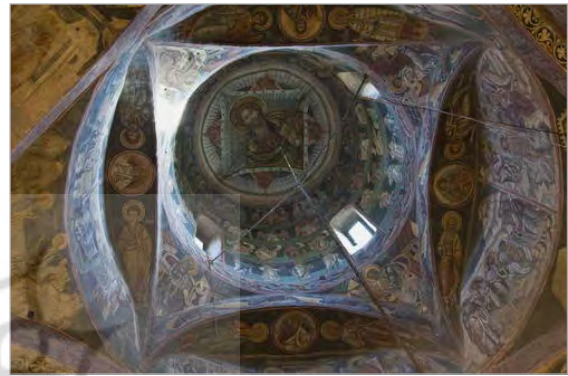
تصویر ۲. دیوارنگاره‌های موجود در فضای داخلی کلیسای سنت جورج صومعه Voronet سابق.