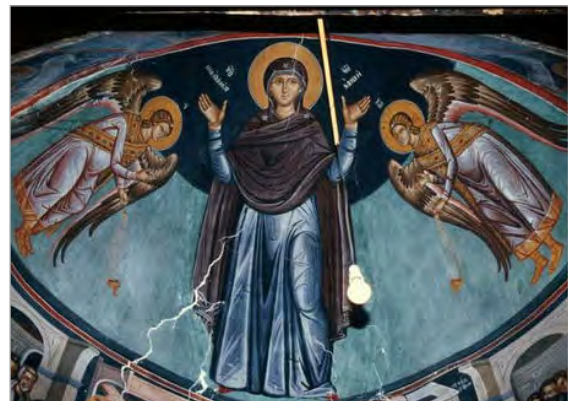
تصویر ۵. نمونه‌هایی از دیوارنگاره‌های موجود در فضای داخلی کلیساهای منطقه تردوس