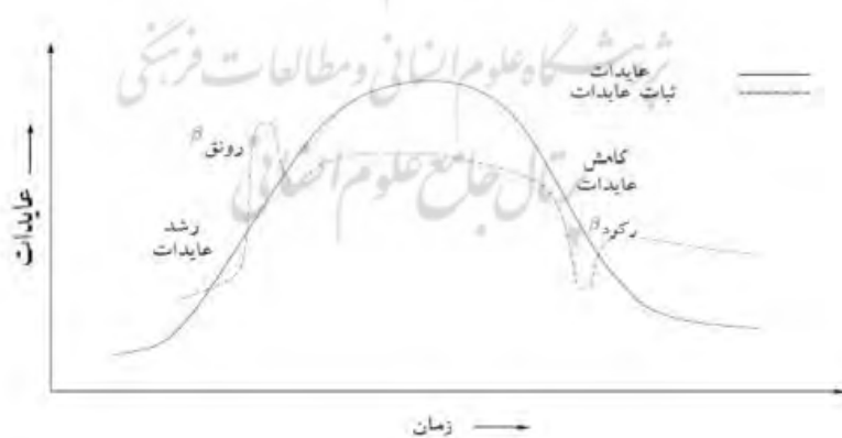
شکل ۱. پایداری سود در شرایط مختلف تجاری

سود حسابداری تحت تأثیر شرایط اقتصادی (رونق یا رکود) قرار می‌گیرد. در دوره رونق، تقاضا برای کالاها و خدمات از یک پایداری نسبی روبه‌رشد برخوردار است. همچنین در این دوره عدم اطمینان در اقتصاد، در سطح پایینی قرار دارد؛ بنابراین انتظار می‌رود که وضعیت شرکت نوسان کمتری داشته باشد و در نتیجه آن، سود شرکت که شاخصی از وضعیت شرکت است، از پایداری بالایی برخوردار باشد. در دوره رکود نیز چون تقاضا کاهش می‌یابد، شرایط عدم اطمینان سرتاسر اقتصاد را فرامی‌گیرد و از آنجا که شرکت‌ها نیز بخشی از این اقتصاد هستند، این انتظار وجود دارد که وضعیت شرکت نیز دچار نوسان شود. بنابراین سود در دوران رکود از پایداری کمی برخوردار است (تامی، ۲۰۱۲). شکل ۱ پایداری سود در شرایط مختلف تجاری را به‌صورت ترسیمی نشان می‌دهد.