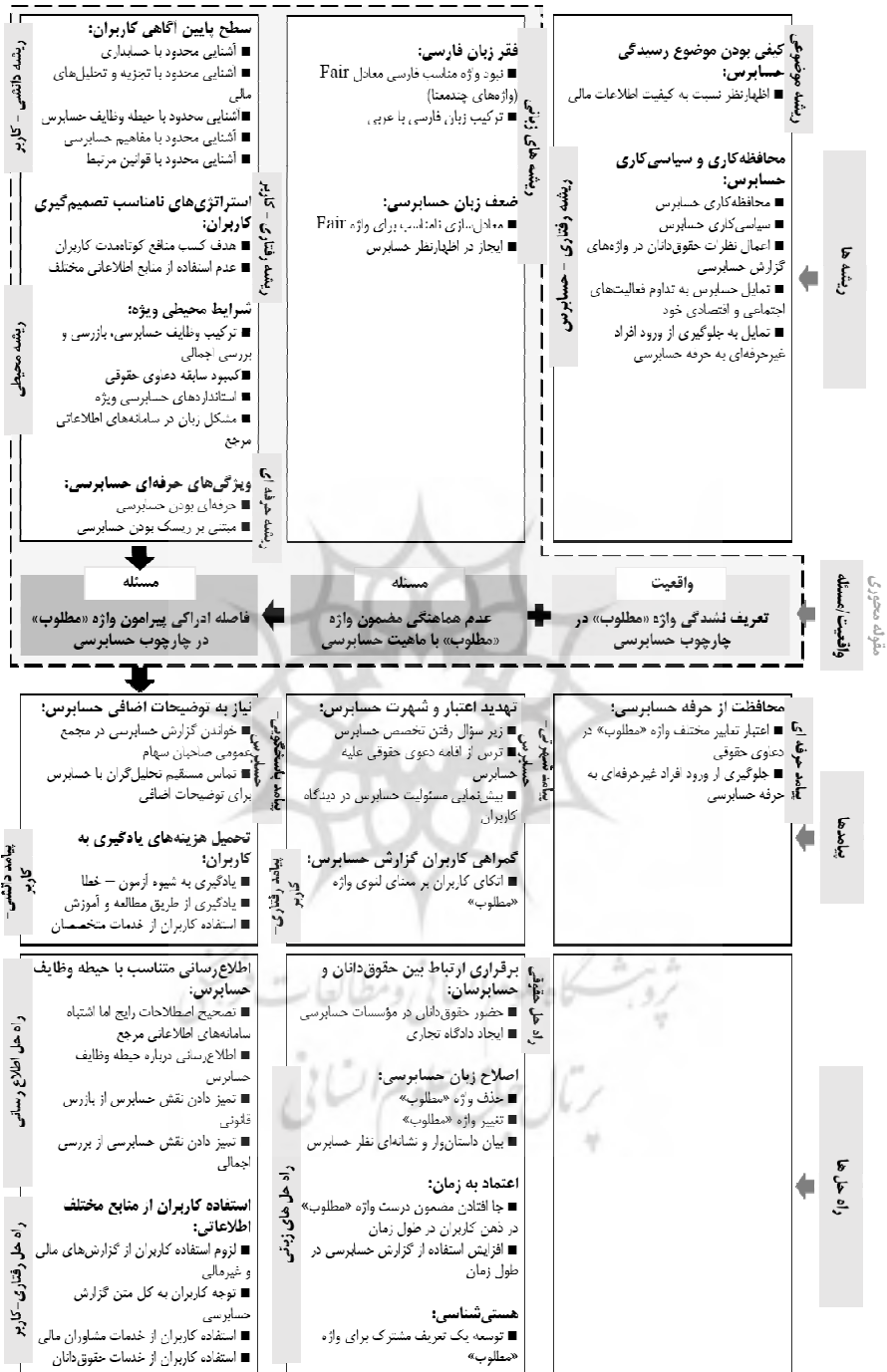
شکل ۲. مسئله‌ها و واقعیت‌ها درباره عبارت «ارائه به نحو مطلوب»