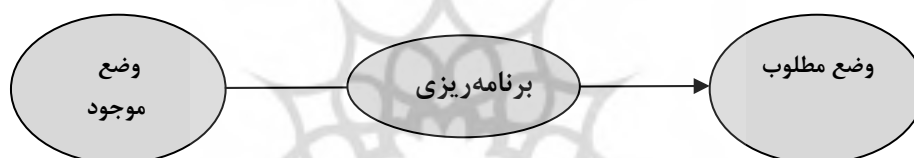
شکل شماره ۲- هدف و ماهیت برنامه‌ریزی

برنامه‌ریزی اقتصادی چیزی جز یک فرآیند اطلاع - تصمیم‌گیری نیست، فرآیندی که طی آن به صورت آگاهانه و ارادی، به منظور حصول به اهداف مشخص (مطلوب) اقتصادی مانند تولید ناخالص ملی، مصرف، سرمایه‌گذاری و... تصمیم‌گیری می‌شود (نظری، همان: ۲۰۷).