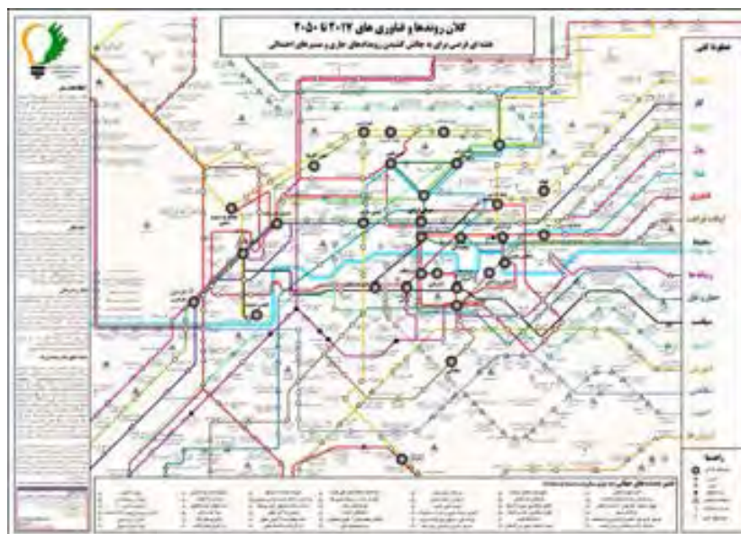
شکل ۵: کلان روندها و فناوری های ۲۰۱۷-۲۰۵۰ منبع: nowandnext.com