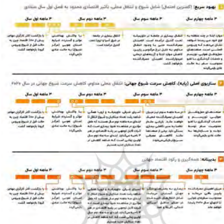
شکل ۴: سناریوهای مختلف در شیوع ویروس کرونا منبع: تجراسا فارسی