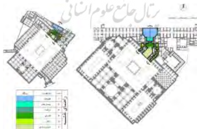
تصویر ۱: فضای ورودی مساجد جامع عباسی و سید اصفهان

ها در قیاس با مدارس دوره صفوی بود ( Bemanian Mo'meni and Sultanzadeh 2013). به همین ترتیب، پژوهش‌هایی نیز، مساجد شهر اصفهان را مورد ارزیابی قرار داده‌اند. چند تحقیق به تحلیل هندسی نما و پلان مسجد شیخ‌لطف‌الله پرداخته‌اند و بررسی داده‌های مطالعات مذکور نشان‌دهنده این است که نظام هندسی نمای مسجد بر پایه شکل پنج ضلعی منتظم بنیان نهاده شده است ( Navai and Haji Ghasemi 2011; Haji Ghasemi 1996). به همین صورت، ابعاد فضای جلوخان ورودی و نمازخانه نیز با یکدیگر متناسب بوده و مکان‌یابی ورودی بنا در بدنه میدان در طی یک فرآیند هندسی شکل گرفته است ( Dahar and Alipour 2013). همچنین در مطالعه‌ای مقایسه‌ای، تناسبات نمای سردر چند نمونه از ابنیه شاخص صفوی در اصفهان (مساجد شیخ‌لطف‌الله، جامع عباسی، حکیم و مدرسه چهارباغ (مادرشاه)) بررسی شده است. یافته‌های پژوهش اخیر بر تمایز آشکار تناسباتی بین مسجد جامع عباسی با دیگر نمونه‌های تحت سنجش تأکید می‌کند ( Pourmand et al. 2014). در بررسی دیگری که در رابطه با مساجد جامع عتیق و عباسی اصفهان صورت گرفته، بر استفاده از راه‌کارهای قرینه‌سازی در چهار سطح محورهای انتظام دهنده، پلان‌ها و همچنین منظرها (نماها) تأکید شده است. نتایج تحقیق، مؤکد بر عدم کسالت و پویایی ذاتی ابنیه تحت سنجش با وجود تکرار روابط سلسله‌مراتب قرینه‌گی بین عناصر کالبدی است ( Bemanian and Nourian