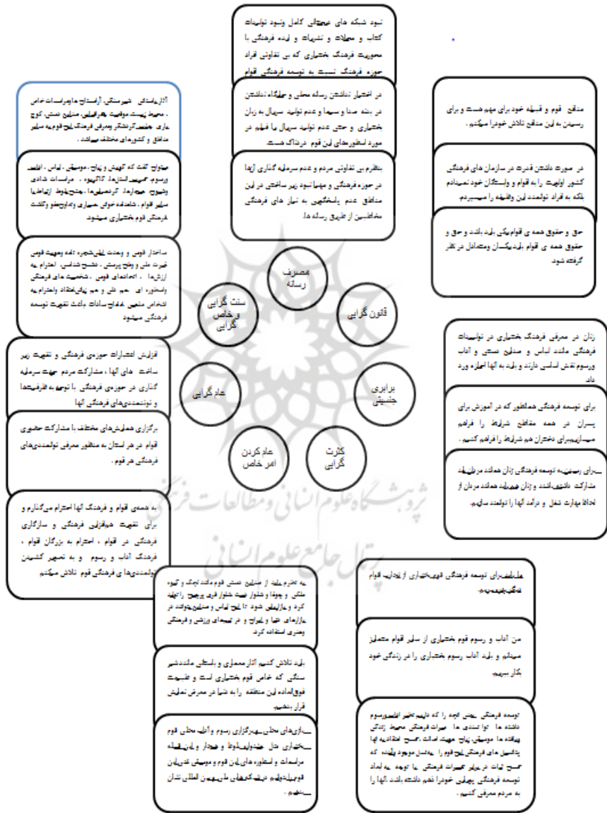
شکل ۱: نمایه‌سازی (مرحله سوم)