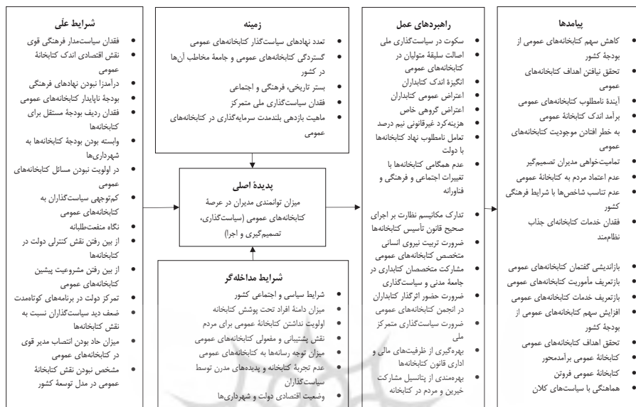
تصویر ۴. مدل پارادایمی میزان توانمندی مدیران در عرصه کتابخانه‌های عمومی

در ادامه، روایتی توصیفی از پدیده مرکزی ارائه می‌شود که به آن «داستان» گفته می‌شود. این داستان سپس در خصوص پدیده مرکزی مفهوم‌سازی می‌شود که هدف آن دست یافتن به «یکپارچگی» است (محمدپور، ۱۳۸۹).