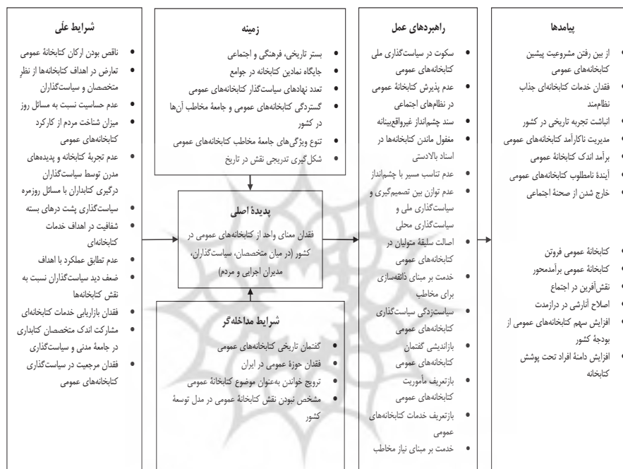
تصویر ۲. مدل پارادایمی فقدان معنای واحد از کتابخانه‌های عمومی در کشور

کتابخانه عمومی، کارکردها، مأموریت‌ها و خدمات آن دارند. با بهره‌گیری از کدگذاری محوری، مدل پارادایمی فقدان معنای واحد از کتابخانه‌های عمومی، شرایط علی آن، شرایط مداخله‌گر، زمینه، راهبردهای عمل و در نهایت پیامدهای به‌کارگیری راهبردها در تصویر ۲ نشان داده شده است.