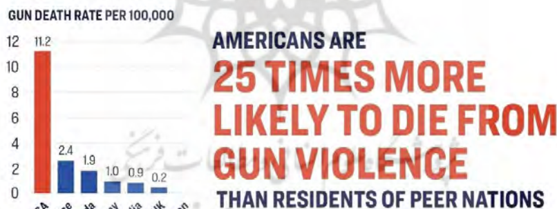
شکل (۱) نمودار تفاوت استفاده از سلاح گرم در آمریکا نسبت به برخی دیگر از کشورها

سیاهان آمریکایی (جوانان سیاه پوست ۱۹ الی ۲۶ ساله) سه برابر میانگین مشابه سفید پوستان است. جالب آنکه میزان بیکاری سیاه پوستان تحصیل کرده با تحصیلات عالی نیز بیش از ۲٫۵ برابر سفیدپوستان با تحصیلات بالا است (دیویس، وثرل و هانری، ۱۳۹۸) سیاهان بارها در ایالات متحده در قبال چنین تبعیض‌هایی اعتراضات وسیعی انجام داده‌اند و همواره قربانی خشونت و قتل شده‌اند بازخورد مهم این سیاست تبعیضی، استفاده از خشونت علیه سیاهان است. این در حالی است که بر اساس یک تحقیق صورت گرفته در سال ۲۰۱۸ از سوی «تحقیقات بین‌المللی» «Global» در ایالات متحده احتمال حمله مسلحانه به یک سیاه پوست آمریکایی بیش از ۲۰ برابر یک فرد سفیدپوست است. به همین دلیل آدام وینکلر، استاد حقوق آمریکایی معتقد است عمده مشکلات، آزار و اذیت نظامی و شکاف بزرگ هویتی سیاه پوستان آمریکایی ناشی از این مسئله است که ایالات متحده در حال حاضر یک جمعیت غیرنظامی به شدت مسلحی را در اختیار دارد (کرامر، ۱۳۹۷: ۶۴۴-۶۴۶). واشنگتن پست نیز در گزارشی اعلام کرد که ایالات متحده دارای بیشترین افراد استفاده کننده از سلاح گرم در جهان است که عمدتاً افراد مهاجم و سیاه پوستان را مورد اصابت قرار می‌دهند (سولومون، مکسول و کاسترو، ۱۳۹۸: ۴۱).