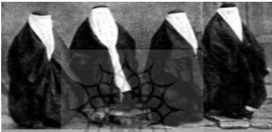
تصویر ۱. پوشش یکسان زن قاجار (چادر و روبنده)

نوع پوشش، همزمان نوعی فرصت نیز برای زنان به همراه می‌آورد؛ چرا که یک زن با چنین پوششی که حتی چهره او را پنهان کرده بود می‌توانست به هرکجا که بخواهد برود بی‌آنکه فردی بتواند او را شناسایی کند؛ زیرا هیچ‌کس حتی شوهرش نیز اجازه نداشت روبنده را در کوچه و خیابان از روی صورت زن بردارد و اگر مردی چنین اشتباه مهلکی مرتکب می‌شد، مجازاتی به‌شدت سخت و در برخی موارد حتی خطر قتل و اعدام در انتظارش بود (بنجامین، ۱۳۶۳: ۸۴). از آنجا که گاه تصاویر، بهتر از کلمات و تعبیر می‌توانند معانی را منتقل کنند لذا عکسی از زنان در دوره قاجار در زیر آورده شده است تا فهم دقیق‌تری از پوشش زنان در دوران قاجار به دست دهد.