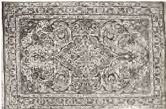
تصویر ۱: نمونه قالی لچک ترنج ساروق (ادواردز، ۱۳۶۸: ۱۲۰)

مستقل و متفاوت از ترنج طراحی شده‌اند، عدد تقسیمات حاشیه فرد است و فضای ساده بافت یا وجود ندارد یا بسیار کوچک است.