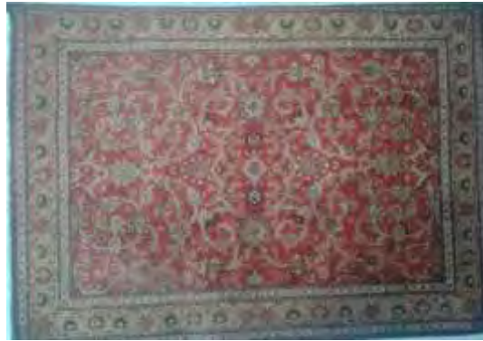
تصویر ۲: قالی افشان ساروق مهاجران (صوراسرافیل، ۱۳۹۵: ۱۷۵)

دسته دوم، طرح‌های یک دوم است که در این نوع از فرش‌ها، طراح تنها یک دوم متن فرش را طراحی می‌کند و نیم دیگر توسط بافنده بافته می‌شود. این فرش‌ها شامل انواع طرح‌های محرابی، درختی، سجاده‌ای و گلدانی می‌شود. فرش‌های پرده‌ای یا محرابی در دو نوع «پرده‌ای ستون‌دار» و «پرده‌ای دسته‌گلی» در منطقه اراک رایج است. این نوع نقش‌ها منحصراً بر روی فرش‌های کوچک و به‌خصوص در اندازه «دو ذرع» بافته می‌شود.