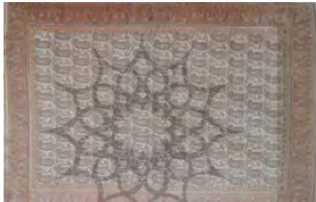
تصویر ۴: طرح واگیره‌ای؛ بنه جقه‌ای ساروق (صوراسرافیل، ۱۳۷۲: ۳۵)

ذهنی نبوده است؛ نقوش واگیره‌ها، اکثراً در قسمت اتصال به حاشیه منظم هستند. اصول طراحی سنتی در تکرار واگیره‌های زمینه به گونه‌ای عمل می‌کند که تقسیماتی منظم در سرتاسر زمینه انجام شود و قسمت‌های مماس با حاشیه صورتی منظم داشته باشد؛ در بیش‌تر نمونه‌های این فرش، نواری تزیین شده در قسمت مماس حاشیه با زمینه طرح شده است که این حاشیه یا نوار تزیین شده، با حاشیه باریک و با رنگ‌بندی زمینه، هم‌عرض است و خط یا قاب جدا کننده‌ای آن را از زمینه جدا نمی‌کند لذا کاملاً جزیی از نقش زمینه به حساب می‌آید؛ عدد حاشیه‌بندی‌ها فرد است؛ گوشه‌سازی دقیقی در حاشیه‌ها صورت نگرفته ولی نحوه ترکیب نقوش در گوشه‌های حاشیه در هر چهار قسمت فرش یکسان است؛ رنگ‌های غالب در تمامی نمونه‌ها سورمه‌ای و قرمز است؛ رنگ‌های تیره سورمه‌ای و قرمز در کنار رنگی روشن چون سفید و کرم به تعادل رنگی طرح کمک کرده است و سرانجام تمامی فضای طرح‌های واگیره‌ای با تکرار نقوش پر شده و از ایجاد فضاهای خالی اجتناب شده است.