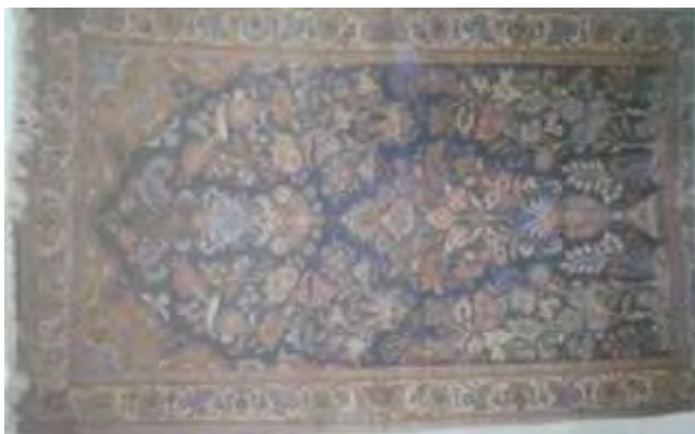
تصویر ۳: قالی با نقش پرده‌ای دسته‌گلی (فونتن، ۱۳۷۵: ۱۸۳)

دسته سوم، طرح‌های واگیره‌ای است. واگیره یک واحد منقوش است که با تکرار آن، متن را پر می‌کنند. واگیره‌ها در صورتی که بدون شبکه‌بندی متن فرش حاصل شوند بدان «واگیره» محض می‌گویند. اما اگر از طریق شبکه‌بندی متن، ایجاد شده باشند، عموماً به شکل خشتی، خواه لوزی، خواه مربع یا بندی و دیگر اشکال است. نمونه‌های موجود قالی‌های اراک نشان می‌دهد طرح‌های واگیره‌ای حجم بسیاری از قالی‌ها را شامل می‌شود. تکثیر واگیره‌ها در سطح فرش به دو روش انتقالی و انعکاسی صورت می‌گیرد. در روش انتقالی، نقش واگیره بدون هیچ گونه چرخش یا انعکاسی عیناً به نقطه دیگر منتقل شده و در سرتاسر متن فرش تکرار می‌شود. روش انتقالی را «سرهیم سوار» نیز می‌گویند. زیرا واگیره‌ها عیناً بر بالای سرهیم منتقل شده و سطح را پوشانده‌اند. در روش انعکاسی، نقوش واگیره از یک سمت به صورت قرینه انعکاس یافته و تکرار می‌شود. قالی‌های منطقه اراک و روستاهای اطراف آن از این ساختارها در طرح‌های خود بسیار بهره جسته‌اند.