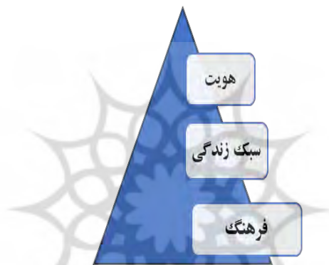
شکل ۱- ارتباط فرهنگ، سبک زندگی و هویت

هرکدام بر اساس سبک زندگی‌شان، دارای ذائقه و منش خاصی هستند که آن‌ها را از یکدیگر منفک و متمایز می‌سازد. بر این اساس، می‌توان گفت که سبک زندگی، نشان‌دهنده هویت جنسیتی افراد است. زیرا در چنین شرایطی که سبک زندگی، به یک امر نمادین و اجتماعی تبدیل شده، خودش قادر است تبدیل به بیانی؛ برای هویت‌های فردی زنان و مردان شود. لذا آنان می‌توانند برای رساندن پیام هویتی خود از سبک زندگی استفاده کنند و از این طریق، بر دیگرانی که اطراف آن‌ها هستند تأثیر بگذارند.