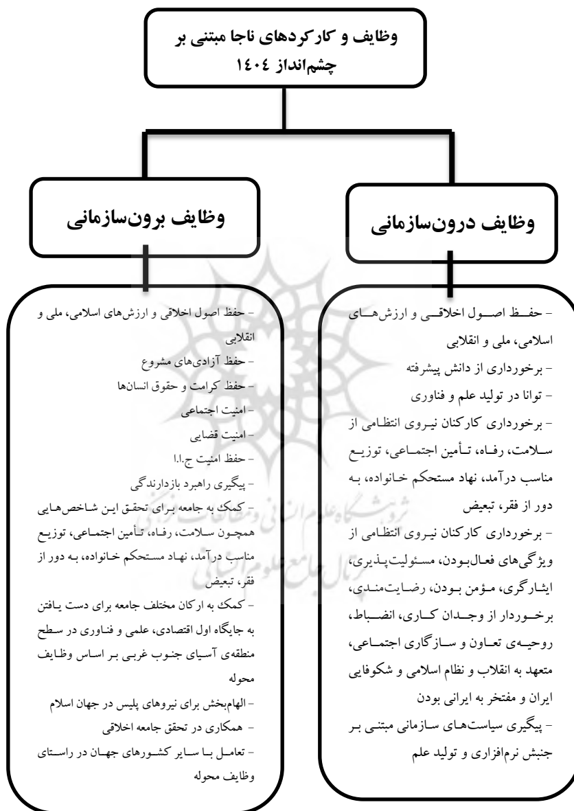
شکل شماره ۱: وظایف نیروی انتظامی بر اساس سند چشم انداز ۱۴۰۴

در قبال جامعه و سایر ارکان جامعه که در شکل (۱) به این وظایف و کارکردها اشاره می‌شود.