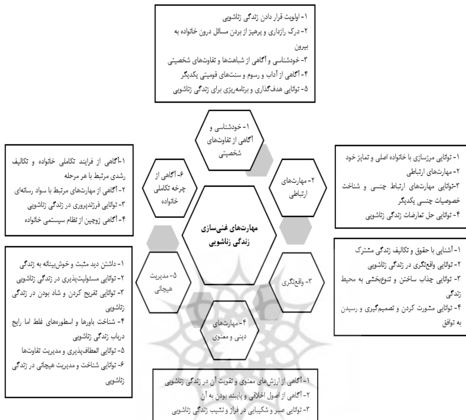
شکل ۲: عامل‌ها و عبارات‌های غنی‌سازی زندگی زناشویی