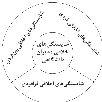
شکل ۳: مدل نظری شایستگی‌های اخلاقی مدیران دانشگاهی

مجموعه سازمان باید بهره‌مند باشد. شایستگی‌های اخلاقی سازمانی، اشاره به ویژگی‌های رفتاری رهبران برای تحقق نتایج مطلوب سازمانی و اقدام در چارچوب فرهنگ سازمانی دارد. (اینتا گلیاتا و دیگران ۱ ، ۲۰۰۰؛ به نقل از بنیادی نایینی و تشکری، ۱۳۹۱) شایستگی سازمانی، شایستگی‌هایی است که به اثربخشی کل سازمان و نظام نیز کمک می‌کند. (کریمی و صالحی، ۱۳۸۸؛ به نقل از اکرامی و رجب‌زاده، ۱۳۹۰: ۱۰) شایستگی‌های اخلاقی فرافردی مدیران، از جمله این موارد است: پرهیز از پنهان‌کاری، رعایت قوانین، مقدس شمردن خدمت‌رسانی، مصلحت‌اندیشی، احساس مسئولیت‌پذیری، مشارکت‌جویی و وجدان‌کاری. در نهایت بعد از ایجاد یک ترکیب جدید از یافته‌های پیشین، الگوی شایستگی اخلاقی مدیران دانشگاهی طبق شکل ۳ ترسیم شد: