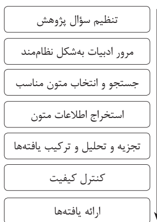
شکل ۱: مراحل پیاده‌سازی فراترکیب

به منظور تحقق هدف مقاله، محققان پژوهش‌هایی را که تاکنون در حوزه شایستگی اخلاقی مدیران در داخل و خارج انجام شده است مورد بررسی قرار داده و در این راه از روش هفت مرحله‌ای باروسو و ساندلوسکی ۱ (کمالی، ۱۳۹۶: ۷۲۸) استفاده کرده‌اند که خلاصه این مراحل در شکل ۱ ارائه شده است. بر اساس این جدول، مراحل مبسوط پیاده‌سازی روش فراترکیب به شرح زیر می‌باشد.