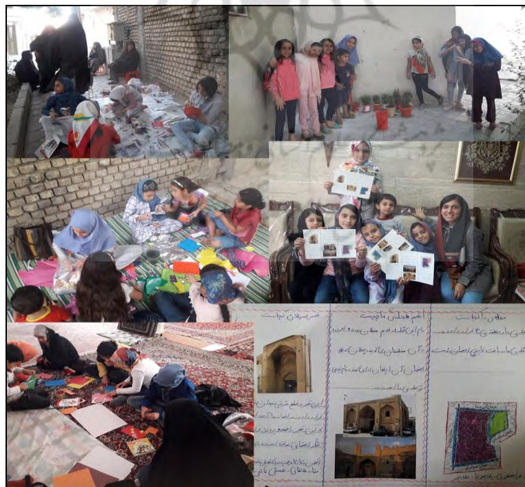
شکل ۲- کودکان در حال انجام فعالیت‌های مشارکتی

جالب توجهی درباره فرزندانشان دارند. این تعامل از ابتدای سال ۱۳۹۸ تا زمان نوشتن مقاله در جریان است. در ادامه فرایند پژوهش، ۸ فعالیت مشارکتی مرتبط با فضای سبز ذکر شده طراحی شد. طراحی این فعالیت‌ها با توجه به اولویت‌های کودکان درباره این فضای سبز انجام شد؛ درواقع، پژوهشگر از کودکان خواست فضای سبز دلخواهشان را نقاشی کنند یا درباره آن مطلب بنویسند و متناسب با توان کودک در برآورده‌سازی آنچه در ذهن دارد، این فعالیت‌ها درباره فضای سبز ذکر شده و استفاده در آن طراحی شدند. این فعالیت‌ها عبارت‌اند از: رنگ‌آمیزی گلدان‌های گل سفالی، گلکاری در گلدان‌های سفالی رنگ‌شده، کاربردی کردن گلدان‌های پلاستیکی دورریختنی، تهیه روزنامه دیواری معرفی محله، تهیه روزنامه دیواری اریگامی حیوانات، تهیه روزنامه دیواری اریگامی گیاهان، تهیه روزنامه دیواری بازیافت، تهیه نامه به شهردار منطقه ۳ درباره ایجاد تغییر در فضای سبز. در طراحی این ۸ فعالیت ۵ معیار در نظر گرفته شد: برای کودکان انجام‌شدنی باشد، جدید و جذاب باشد، خطرناک