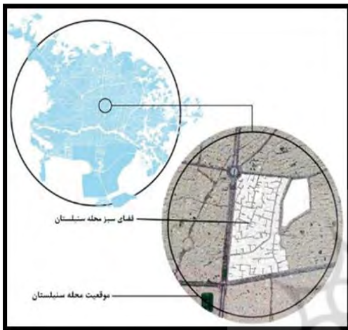
شکل ۱- نقشه جغرافیایی محله سنبلستان

در این پژوهش محله سنبلستان، محدوده مطالعه در نظر گرفته شد. این محله، با جمعیت ۲۷۷۷ نفر، در منطقه ۳ شهرداری اصفهان در مرکز شهر قرار دارد. به‌طور کلی، جمعیت، وسعت، سابقه تاریخی، روابط اجتماعی موجود میان ساکنان، قرارگرفتن در مرکز شهر و در بافت تاریخی، دلایل انتخاب این محله برای پژوهش اقدامی بود.