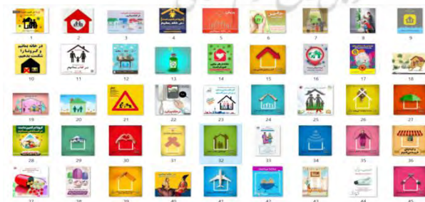
شکل ۱. تصویرهایی گردآوری شده با موضوع «در خانه بمانیم» و «در خانه می‌مانیم»

به منظور آشنایی بیشتر، نمایی از همه تصویرهایی تحلیل شده در شکل شماره (۱)، ارائه شده است.