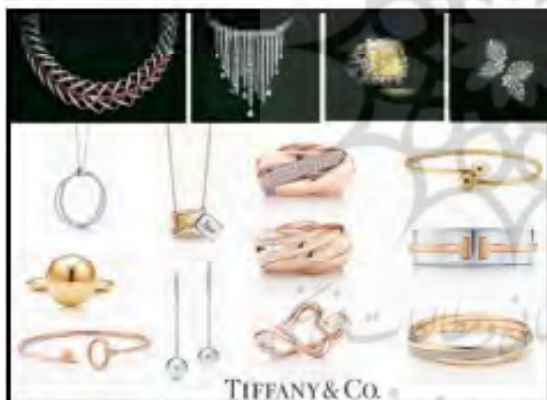
تصویر ۲. مجموعه ارائه شده به دانشجویان از جدیدترین طراحی های برند تیفانی اندکو در سال ۲۰۱۷ (URL: 1)