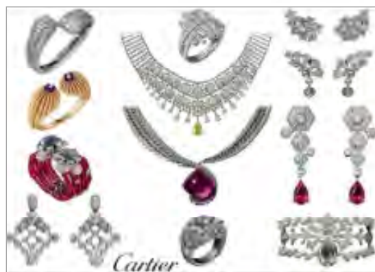
تصویر ۳. مجموعه ارائه شده به دانشجویان از جدیدترین طراحی های برند کارتیه در سال ۲۰۱۷ (URL: 2)

انتخاب نمایند. انتخاب گزینه های پنج درجه ای برای ایجاد سهولت بیشتر، هم برای مخاطبان در بیان نظرات خود و هم برای نگارندگان برای ارزشیابی و تحلیل نتایج به دست آمده، صورت گرفته است.