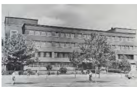
(Batur, 2005: 83)