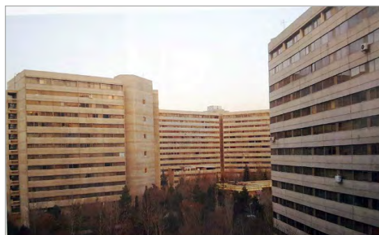
تصویر ۸. شهرک اکباتان تهران (قبادیان، ۱۳۹۲: ۲۵۱)

علت دیگر حضور معماران خارجی در ایران، دعوت از معماران مشهور کشورها و تأسیس شرکت‌هایشان در ایران به واسطه آشنایی معماران ایرانی تحصیل کرده در خارج با آنها بود. مهم‌ترین اثر به‌جامانده از معماران خارجی در این جریان، هتل هیلتون با طراحی راگلان اسکوایر ۵۸ به همراه جمعی از معماران ایرانی است. این بناها به سبک‌های مدنظر معماران بنا و بدون توجه به سنت‌های معماری ایرانی طراحی شده بود. مواجهه با بحران کمبود مسکن در شهرهای بزرگ در دهه ۱۳۲۰ه.ش. (۱۹۴۰م.) و ۱۳۳۰ه.ش. (۱۹۵۰م.)، با حضور شرکت‌های عمدتاً آمریکایی در طرح‌های انبوه‌سازی مسکن به‌شیوه مدرنیسم بین‌الملل همراه بود. بهترین نمونه این جریان در ایران، شهرک اکباتان (تصویر ۸) تهران است. در نقد این