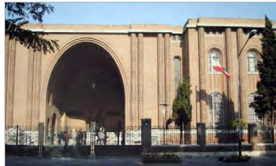
تصویر ۵. سردر ورودی موزه ایران باستان با الهام از طاق کسری (قبادیان، ۱۳۹۲: ۱۹۲)