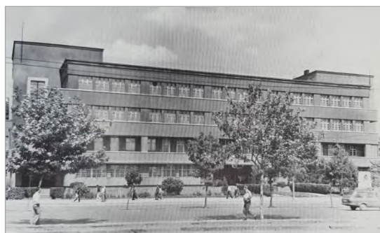
تصویر ۲. انستیتوی دختران عصمت اینونو (Batur, 2005: 83)

در سال‌های پایانی دهه بیست، مهم‌ترین پروژه‌ای که در ترکیه به خارجیان واگذار شد، طرح جامع آنکارا بود. برنده این