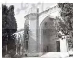
(قبادیان، ۱۳۹۲: ۱۴۳)