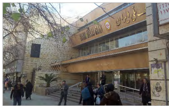
تصویر ۷. بانک ملی ایران شعبه دانشگاه تهران (نگارندگان، ۱۳۹۴)