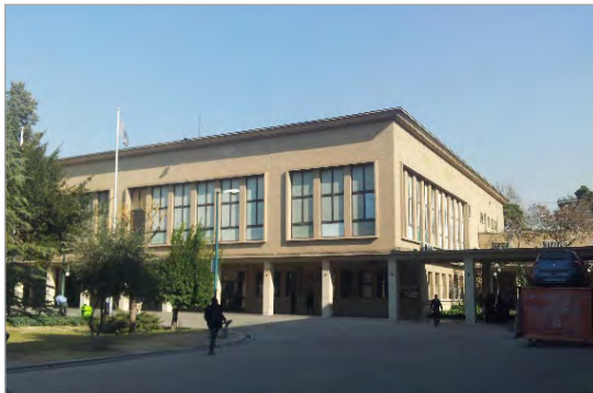
تصویر ۶. دانشکده هنرهای زیبای دانشگاه تهران