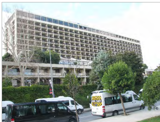
تصویر ۴. هتل هیلتون استانبول

حضور آندره گذار ۴۱ فرانسوی، اولین رئیس این مجموعه آموزشی، تأثیر چشمگیری در انتخاب شیوه آموزش داشته است. پس از گذار در زمان ریاست محسن فروغی، شیوه آموزش معماری این دانشکده دنبال شد و در زمان ریاست هوشنگ سیحون که از فارغ‌التحصیلان این مدرسه بود و تحصیلات خود را در فرانسه تکمیل کرد، مطالعه و آشنایی با معماری بومی ایران از طریق سفرهای دانشجویی رایج شد. در زمان ریاست محمدامین میرفندرسکی و با حضور استادان جدید در دانشکده، سیستم آموزش آتلیه‌ای دگرگون شد و با تأسیس دومین دانشکده معماری ایران، ۲۱ سال بعد از تأسیس دانشگاه تهران در دانشگاه ملی (شهید بهشتی کنونی)، آموزش معماری در ایران، متحول شد. در دانشکده هنرهای زیبا «دانشجویان معماری توسط اساتیدی تعلیم داده می‌شدند که خود، اکثراً در مکتب مدرن، تحصیل کرده و عمری را در آن محیط سپری کرده بودند و منبع الهام دانشجویان معماری آن دوره برای درک تحولات جهانی بودند» (ثبات ثانی، ۱۳۹۲: ۵۳). در حالی که در دانشگاه ملی که اکثر استادان آن فارغ‌التحصیل ایتالیا بودند، برخلاف سیستم آتلیه‌ای دانشکده هنرهای زیبا که دانشجویان، تنها با یک استاد کرکسیون می‌کردند، با استادان مختلف سروکار