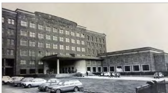
تصویر ۳. دانشکده زبان و تاریخ و جغرافی (Batur, 2005: 87)

در دهه ۱۹۵۰ م. در ترکیه با پایان بحران پس از جنگ، مفهوم غرب برای ترک‌ها از اروپا به آمریکا تغییر یافت. زمینه‌ساز این پدیده، کمک‌های مالی و نظامی و مستشاری آمریکا در