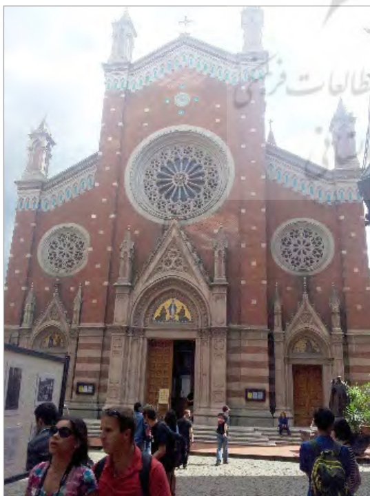
تصویر ۱. کلیسای سنت آنتوان اثر گولیو مونگری (نگارنگان، ۱۳۹۳)

جانشین اگلی در دانشکده هنرهای زیبا و مدیریت دفتر معماری وزارت آموزش در آنکارا برونو تائوت بود. «رهبر جریان اکسپرسیونیسم در سال‌های دهه ۱۹۱۰ م. و برنامه خانه‌سازی اجتماعی بین سال‌های ۱۹۲۴ تا ۱۹۳۳ م.، آلمان را در سال ۱۹۳۳ م. ترک کرد و پس از آنکه سه سال را در