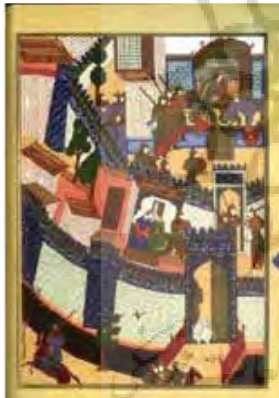
تصویر ۱. نگاره خوان هفتم اسفندیار، منسوب به غیاث‌الدین در شاهنامه بایسنقری (کاخ گلستان).

باید نوشته او به مخاطب پاسخ دهد، چرایی این انتخاب است. یعنی چرایی انتخاب بارگاه این دو پادشاه خاص، و یا چرایی انتخاب سیب و پرتقال است، و نه گلابی و موز. عقلانیت پشت زمینه انتخاب پژوهشگر، همان بنیاد یا زمینه‌های تطبیق است. دلایل و جهات معقولی که براساس چارچوب ارجاع به پژوهشگر اجازه داده تا این موارد را برای هم‌سنجی انتخاب کند، زمینه و دلایل کار تطبیق خوانده می‌شود. گاه این دلایل آشکار است و آسان، و گاه پیچیده و نیازمند به تحلیل و توضیح. برای نمونه در یک مقاله که به مقایسه تأثیر باران اسیدی بر جنگل‌ها می‌پردازد، انتخاب دو جنگل از جانب نویسنده خیلی آشکار و آسان نیست چراکه هم می‌توانسته به دو جنگل هم‌سن و سال در دو نقطه مختلف بپردازد و هم می‌توانسته یک جنگل جدید در کوهستان سفید را با یک جنگل قدیمی در همان منطقه مقایسه کند. همین جاست که لازم می‌آید، محقق دلایل انتخاب خود را روشن سازد که مثلاً چرا یک منطقه در دو دوره تاریخی به‌جای دو جنگل هم‌سن و سال در دو منطقه برای تحقیق گزینش شده‌اند.